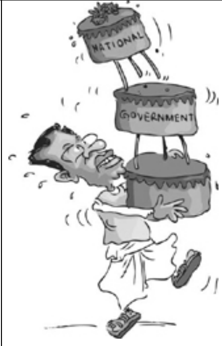
பொதுமக்களிடம் வாக்குக் கேட்டனர்.

ஜனவரி 08ஆம் திகதி ஆட்சி மாற்றத்தைச் செய்ய வேண்டும் என்று கோரியவர்கள், 'நாட்டில் சர்வாதிகாரம் தலைதூக்கியுள்ளது. ஒரு குடும்பத்தின் ஆட்சி நடைபெறுகிறது. இலஞ்சமும் ஊழலும் தலைவிரித்தாடுகின்றது. இதற்கெல்லாம் காரணம் நிறைவேற்று அதிகாரம் உள்ள ஜனாதிபதி முறை இருப்பதும், அதை ஜனாதிபதி பதவியில் இருப்பவர் பிரயோகிப்பதும் தான் காரணம்' எனக் கூறியே