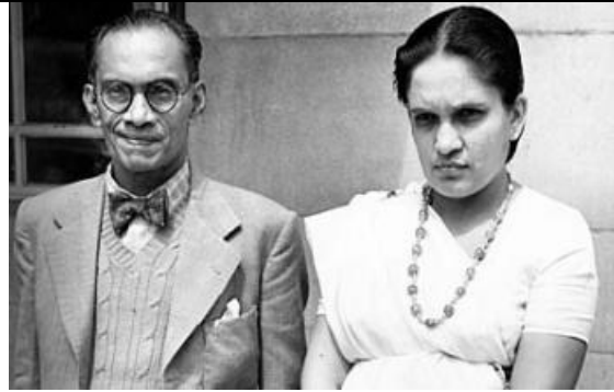
பண்டாரநாயக்க - சிறீமாவோ

அதன்காரணமாக சுதந்திர இலங்கையின் முதலாவது அரசாங்கமான ஐ.தே.கவின் டி.எஸ்.சேனநாயக்க அமைச்சரவையில் தான் வகித்து வந்த சுகாதார அமைச்சர் பதவியைத் துறந்துவிட்டு இலங்கை மக்களின் அபிவாசைகளைப் பிரதிபலிக்கும் சிறீலங்கா சுதந்திரக் கட்சியை 1951இல் நிறுவினார்.