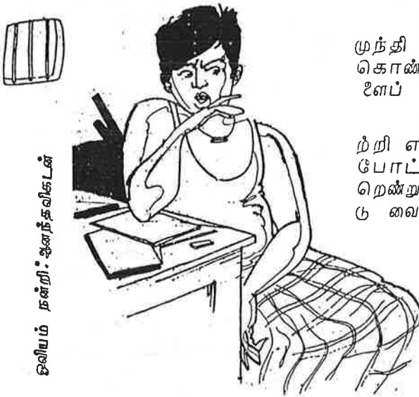
ஒவியம் நன்றி: ஆனந்தவிகடன்

ஆனால் எந்த இயக்கம் பற்றி எழுதுவது? இயக்கப் பேர் போட்டு எழுதினால் ஜேர்னலிஸ்த்ரெண்டும் பார்க்காமல் பொட்டு வைத்துவிடுவான்கள். பேர்