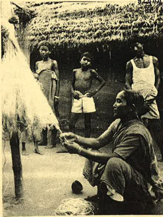
எதுவுமேயில்லாமல், வாழப் போராடி, நசுக்கப் பட்டுக் கொண்டிருக்கும் எங்களுக்காக, எங்களைப் பற்றி உங்கள் பேரூக்கள் எழுதட்டும்.

RAYA 87 RUE DE COLOMBES 92600, ASNIERES SUR - SEINE ; FRANCE