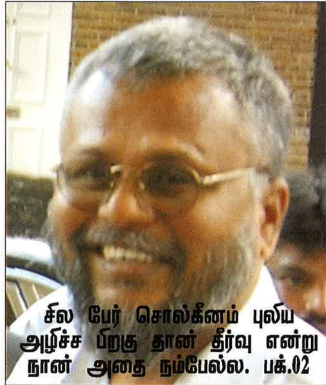
சீல பேர் சொல்கீனம் புலய அழ்ச்ச ப்றகு தான் தீர்வு என்று நான் அதை நம்பேல்ல. பக்.02