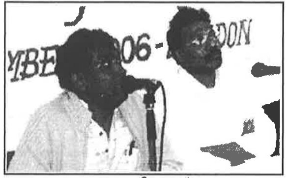
அகரா - தேவதாசன்