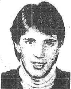
An off centre and full neckline are the main features on this conservative, short precision scissor cut. May be blown on air dried