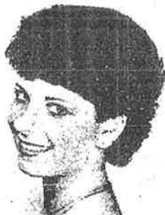
Prestige- a short cut featuring a perm Easy-to- look after Lamp or air dried