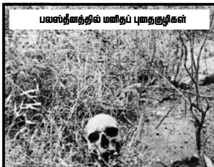
பலஸ்தீனத்தில் மனிதப் புதைகுழிகள்

ரம்பினால் கைப்பற்றிய பிரதேசங்களை மீள கையளிப்பதன் மூலம் அரசியல், இராஜ தந்திர உறவுகளை வலுப்படுத்திக் கொண்டதுடன், அரபுக் ஒருமைப்பாட்டை பலவீனப்படுத்தி வருவதிலும் வெற்றி கண்டு வருகின்றது. இந்த அணுகுமுறைகளில் காட்டும் வேகத்தை பலஸ்தீன பிரச்சனையை முடிவிற்கு கொண்டு வருவதில் காட்டாது இழுத்தடித்து வருவது நன்கு அறிந்ததே. இந்த நிலையில் பலஸ்தீன பிரச்சனையை தீர்ப்பதற்கு மிகுந்த