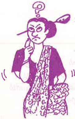
பெண்ணுக்கு முளை கரண்டியளவு