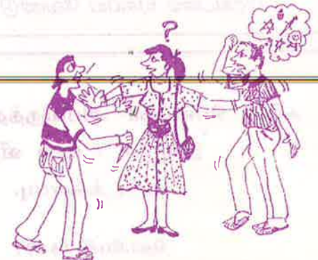
பிணக்குகள் எல்லாம் பெண்களால் தான்