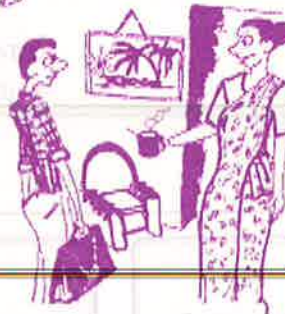
கோடி ஒரு வெள்ளைக்கு குமரி ஒரு பிள்ளைக்கு