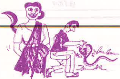
சீறும் பாய்பை நம்பலாம் சிரிக்கும் பெண்ணை நம்பாதே