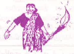
ஆள்வதும் பெண்ணால் அழிவதும் பெண்ணால்