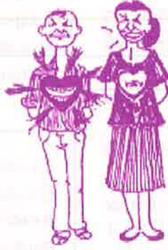
ஆண்கள் இதயத்தால் சிரிப்பார்கள் பெண்கள் உதட்டால் சிரிப்பார்கள்