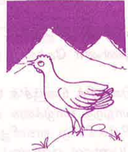
பெட்டைக்கோழி கூவி பொழுது விடியாது