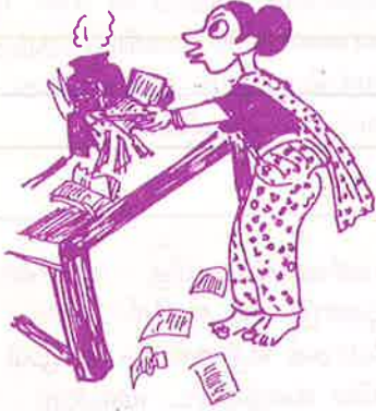
அடுப்பு ஊதும் பெண்ணுக்கு படிப்பெதற்கு