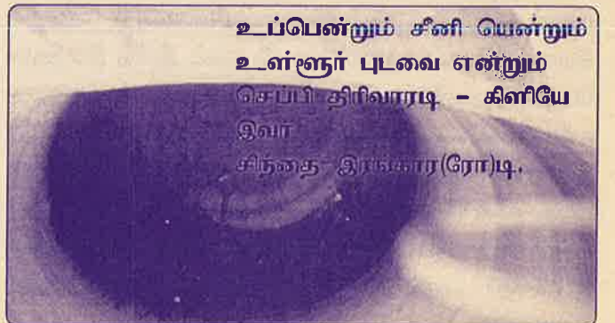
உப்பென்றும் சீனி யென்றும் உள்ளூர் புடவை என்றும் செய்யி திரிவாரடி - கிளியே இவர் சிறுதை இரங்கார(ரோ)டி.

மீண்டும் அந்த 55 குடும்பங்களும் வாழும் குடியிருப்பை அடைந்தோம். மின்சார வசதி அற்ற புதிய குடியிருப்பில் இராப் பொழுதுகள் பயங்கரமாக கழிவதாக மக்கள் தெரிவித்தார்கள். மாலை ஏழு மணிக்குப் பிறகு பெண்கள் வெளியில் செல்வது ஆபத்தாக உள்ளது. ஆற்றிவற்ற விஷப் பூச்சிகள் உட்பட விஷ எண்ணங்கொண்ட சில ஆண்களால் பெண்கள் பல பிரச்சினைகளை எதிர்கொள்ள வேண்டியுள்ளது. இதனால் தமது தற்காலிக இருப்பிடத்தை சுற்றி விளக்குகள் பொருத்த ஜெனரேற்றர் வசதியை ஏதாவது நிறுவனங்களிடம் இவர்கள் எதிர்பார்த்தார்கள். இவர்கள் பகல் பொழுதை கதிரவன் எரித்து ஒளியூட்டினாலும் மீண்டும் வரும் இராப் பொழுதின் இருளை அகற்றுவது யார்? பாதிக்கப்பட்ட மக்களுக்காய் சேவை செய்ய புதிதாய் தொண்டு நிறுவனங்கள் கொடி தூக்கி புறப்பட்டு, பறந்து திரியும் இவ் வேளையில் இவர்கள் இருப்பிடத்திலும், பறப்பவர்களில் சிலலுகள் பதிய வேண்டும் என்பதே இவ்வூர் மக்கள் ஆதங்கங்கள்!