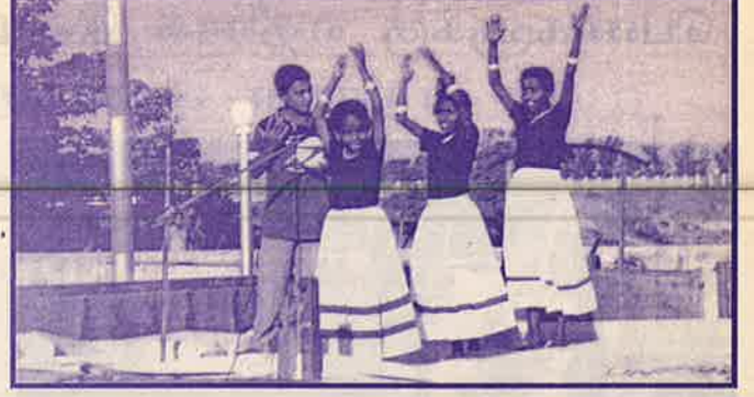
வாய்க்கால் தண்ணி ஆனந்தமாய் ஓட வழி அமைக்கும் பெரியவர்களிடமே சிறுவர் வாழ்வும் ஆனந்தமாய் மாறும் பொறுப்பு உள்ளது என்பதை உணர்த்துவது “ஆனந்தமாய் வாழ்வோம்” நடனம். (நாவற்குடா சிறுவர் குழு)