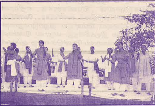
“சிறு நண்டு மணல் மீது படம் ஒன்று கீறும் சிலவேளை இதை வந்துகடல் கொண்டு போகும் எறிகின்ற கடல் என்று மனிதர்கள் அஞ்சார் எது வந்ததெனில் என்ன அதை வென்று செல்வார்” அளிக்கை (சூரியா பாடினிகள் குழு, பல்கலைக் கழக மாணவர்கள், உப பாடினிகள் குழு)