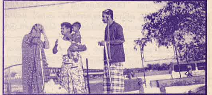
‘வாழ்வில் இல்லை வரட்சி எனும் “துளிர் விடும் துளசி” -நாடகம் (பெண்கள் அபிவிருத்தி மன்றத்தின் கலாபம் கலைக்குழு)