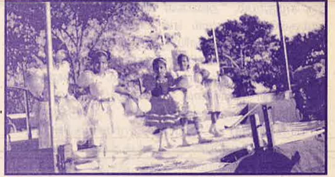
“வாழ்கைக்குமீண்டும் புறப்படுவோம்” அபினயப் பாடல் (மீசான் காத்தான்குடி)