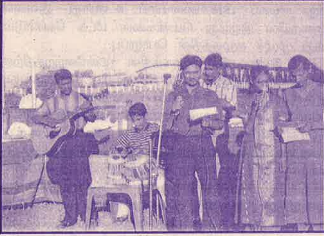
“மீண்டும் எழுவோம்” பாடல் (வண்ணத்துப் பூச்சி பூங்கா, மட்டக்களப்பு)