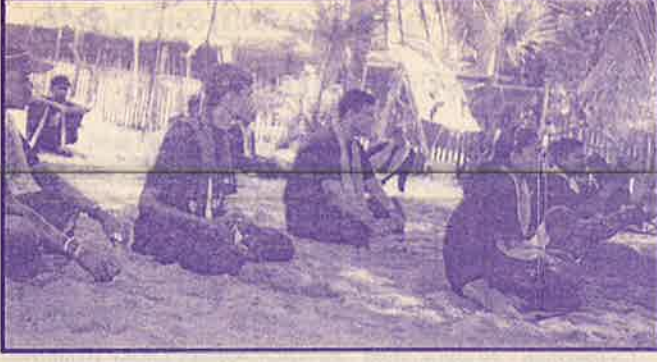
பெண் நொந்தால் சம்பவமாகவும் ஆண் நொந்தால் சரித்திரமாகவும் மாற்றும் சமுதாயத்தின் மாற்றத்திற்காய் கேள்வி கேட்டு நிற்பவர்கள் மூன்றாவது கண் உள்ளூர் அறிவுத்திறன் செயற்பாட்டுக் குழு.