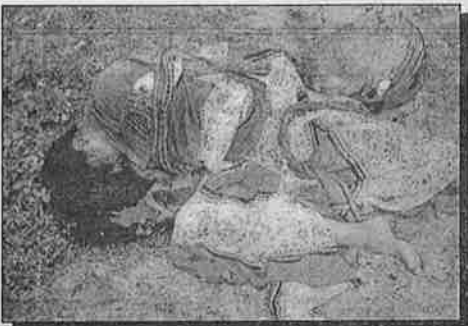
கழுத்து வெட்டி கொலை செய்யப்பட்டு மரத்தில் தூக்கப்பட்ட பெண்ணின் சடலம்.

ஏறாவூரைச் சேர்ந்த 4 பிள்ளைகளின் தாயான 36 வயது பெண்ணைக் கடந்த 99 ஆண்டு தை மாதம் 20ம் திகதி காலை 2 மணியளவில் நான்கு நபர்கள் வீட்டுக்குள் புகுந்து இப் பெண்ணை கடத்திச் சென்று பாலியல் வல்லுறவுக்குள்ளாக்கியதுடன் கழுத்தை வெட்டி மரம் ஒன்றில் தூக்கிவிட்டுள்ளனர். குற்றம் சாட்டப் பட்ட நபர்கள் கைது செய்யப்பட்டு விளக்கமறியலில் வைக்கப்பட்டனர். தற்போது மேல் நீதிமன்றில், வழக்கு விசாரணை இடம் பெற்று வருகின்றது. இதுபோன்று ஏறாவூரில் 4 பெண்கள் இனந் தெரியாத குழுவினரால் கடத்திச் செல்லப்பட்டு பாலியல் வல்லுறவுக் குள்ளாக் கப்பட்டு கொலை செய்யப்பட்டது குறிப்பிடத்தக்கது.