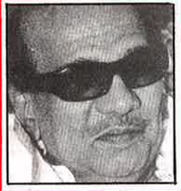
மதராஸில் மழைபெய்தால் ஈழத்திற் குடை பிடிக்கிறார்கள் சிவசேகரம்