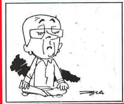
'சோ'வின் தீர்க்க தரிசனம் சகாதேவன்