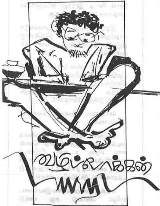
ஒகஸ்ட் - செப்-ஒக்டோபர்

விடிய விடிய நல்லா மழை பெய்துக் கொண்டிருந்தது. இறுக்கிப் போர்த்துக் கொண்டு படுத்திருந்தான். புலிகளின்ரை போக்குப் பற்றி என்றை மனம் அலட்டிக் கொண்டிருந்தது. முல்லைத்தீவுப் பக்கத்திலை கொஞ்ச மாவது நிண்டு பிடிப்பாங்கள் என்று இஞ்சினை கதைச்சினம் அது நடக்கேல்லை. ஆனையிறவு முல்லைத் தீவு பூனகரி என்று எல்லாத்றையும் பறிகுடுத்தாச் சுது. முந்தி எல்லாத்றையும் குடுத்துக் கடைசியாய் வட மராட்சியையும் குடுக்க வேண்டி வந்தது போலத்தான். நல்லவேளையா அந்தநேரம் இந்தியாக் காறன் வந்து சேர்ந்தான். இல்லாட்டி வரலாறு எப்படிப் போயிருக்குமோ சிங்கள ஆயியன் அந்தநேரம் வல்லு வெட்டித்துறையிலை செய்த அனியா யத்தைப் பார்த்தால் விளங்கியிருக்கும். வடமராட்சியை அவங்கள் பிடிச்ச வேகத்தைப் பார்த்தால் அப்படியே முழுவதையும் பிடிச்சிருப் பாங்கள் போலதான் இருந்தது. அந்த நிலைமை தான் இப்ப திரும்பவந் திருக்கு