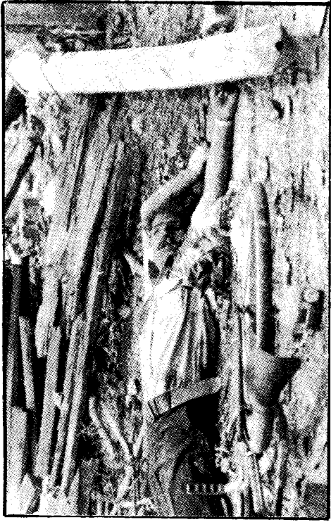
கொலைக்கு அரசே பொறுப்பாளி எனத் தெரிகிறது.

இலங்கையில் உள்ள நெருக்கடும் அதை இலங்கை அரசாங்கம் கையாடும் முறையும் இந்த தீவின் வரலாறு கண்டிராதவடி பெரிய தமிழ் அகதிப் பிரச்சனையை உருவாக்கியுள்ளது. அகதிகளை ஆயுதப் படைபினர் நடத்தும் விதமும் அகதி முகாம்களிலிருந்து வெளியேறுமாறு விடுதலைப் புலிகள் கொடுக்கும் நெருக்கடும் இப் பிரச்சனையை மேலும் மோசமாகக் குகின்றன.