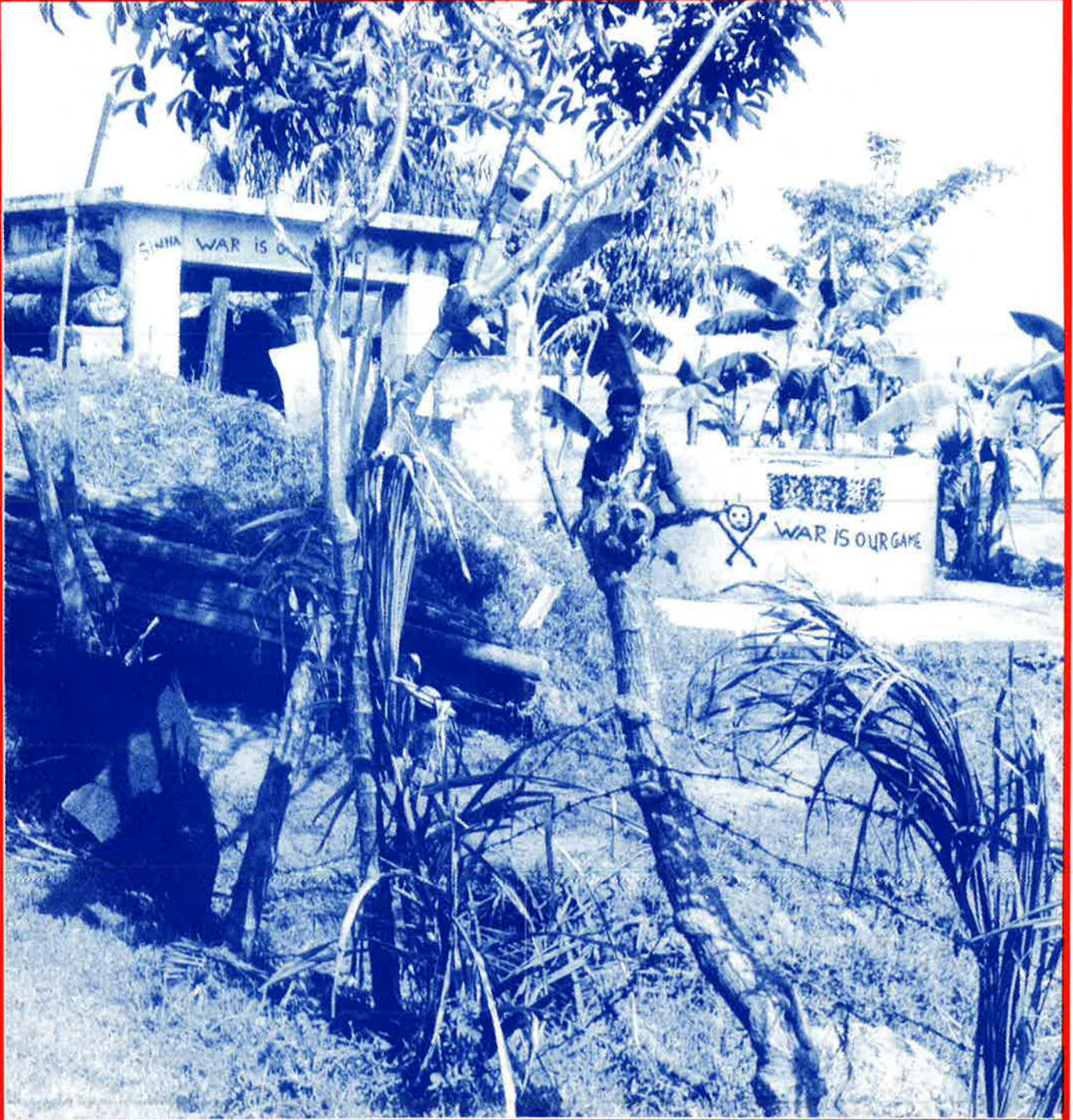
WAR IS OUR GAME (SRI LANKAN ARMY)