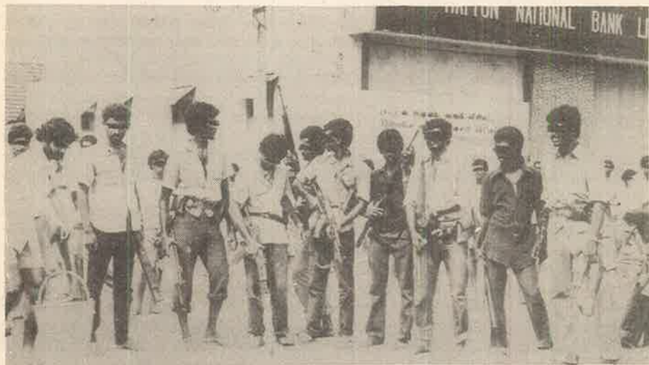
இலங்கையில் தமிழீழ விடுதலைப்புலிப் போராளிகள்

97. தொழிலாளர் புரட்சிக் கட்சியின் (WRP) குத்துக்கரணம் திருபித்தது போன்று மத்திய கிழக்கில் தொழிலாள வர்க்க நலன்கள் காட்டிக் கொடுக்கப்பட்டமையானது, விடாப்பிடியான முறையில் பிரிட்டனிலேயே முதலாளித்துவ வர்க்கத்திற்கு சரணாகி அடைவதற்கு இட்டுச்சென்றது.