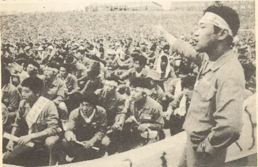
1987 ஆகஸ்டில் வேலை நிறுத்தத்தில் ஈடுபட்டிருந்த தென் கொரியா மோட்டார் வாகனம் செய்யும் தொழிலாளர்கள்

ரீதியான உண்மை என்னவெனில், நாடுகடந்த கூட்டுக்கம்பெனிகள் ஒரு பூர்த்தி செய்யப்பட்ட பண்டத்தை உற்பத்தி செய்வதற்கு பல நாடுகளைச் சேர்ந்த தொழிலாளர்களின் உழைக்கும் சக்தியைச் சரண்டுகின்றன. அதோடு அவை தமது உற்பத்தியை அதி உயர்ந்த லாபத்தைத் தேடி பல் வேறு நாடுகளில், பல்வேறு கண்டங்களில் உள்ள தமது தொழிற்சாலைகளுக்கிடையில் உற்பத்தியை வ்நியோகிப்பகோடு இடம் மாற்றுகின்றன. உதாரணமாக ஃபோர்ட் எஸ்காட் (Ford Escort) ஐரோப்பிய மாடலின் பாகங்கள் உற்பத்திக்காக உபயோகிக்கப்படும் உட்பாக வேலைப் பின்னல்—பிரிட்டனில் கார்புரேட்டர், எண்ணெய் பம்ப், சிலிண்டர் போல்ட்டுகள் — பெல்ஜியத்தில் சீட்பேட்கள் — ஸ்வீடனில் ஹோஸ் கிளாம்ப்ஸ் (Hose Clamps) — டென்மார்க்கில் ஃபேன் பெல்ட்டுகள் — இத் தாலியில் குளர்நீக்கி வளைவுகள் — ஜப்பானில் (Alternators) ஆல்ட்டனேட்டர்ஸ் — அமெரிக்காவில் ஈ. ஜி. ஆர். வால்வுகளையும் சக்கர நட்டுக்களையும் உற்பத்தி செய்வதைக் கொண்டிருக்கிறது. இவ்வாறு முன்னொருபோதும் இல்லாத அளவு மூலதனத்தின் சர்வதேசஇயக்கம் வெவ்வேறு நாடுகளில் உள்ள தொழிலாள வர்க்க இயக்கத்தின் அனைத்து தேசியவாத வேலைத்திட்டங்களையும் காலாவதியாக்கி, முழுமையாக பிற்போக்காக்கின்றது. அப்படியான தேசிய வேலைத்திட்டங்கள், தொழிற்சங்க அதிகாரத்துவங்கள் “அவர்களுடைய” ஆளும் வர்க்கங்களுக்கு தன்னிச்சையாகவே கொடுக்கும் ஒத்துழைப்பை அடிப்படையாகக் கொண்டு. உலகச் சந்தையின் “அவர்களுடைய” முதலாளித்துவ நிலைப்பாட்டைப் பலப்படுத்தும் தேவையுடன் தொழிலாளர்களின் வாழ்க்கைத்தரங்களை வரிசைக்கிரமமாக குறைக்கின்றன