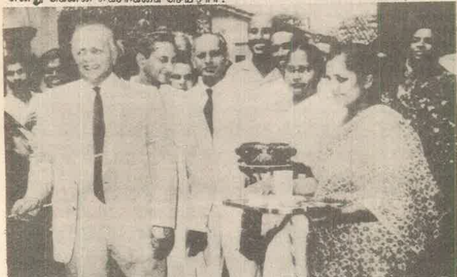
1964ல் இலங்கையில் ஒரு முதலாளித்துவ கூட்டு அராங்கத்தினுள் புகுந்த லங்கா சமராஜக் கட்சியின் காட்டிக் கொடுப்பு