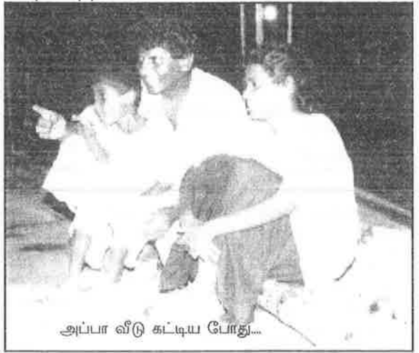
அப்பா வீடு கட்டிய போது...

இடத்தில் இருந்து அகற்றுபம்படி கேட்டனர் ஆஸ்பத்திரி ஊழியர். சிலரின் உதவியுடன் பக்கத்தில் காத்திருக்கும் பகுதியில் கொண்டு வந்து ஸ்ட்ரெச்சரை நிறுத்தினோம். அம்மாவின் தொடர்ச்சியான அவறல் கேட்டுக் கொண்டிருந்தது.