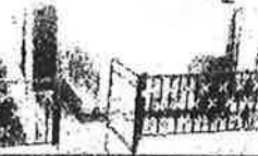
(The caption below the photo is partially illegible but appears to describe the location or the person involved in the crime.)

சந்தேகநபர் கைது - சந்தேகநபர் கைது - சந்தேகநபர் கைது