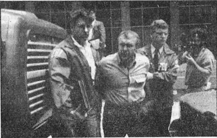
மாஃபியா: மறுசீரமைப்பின் விளைச்சல்.

இப்போது பெருமையுடன் பத்திரிகைக்குப் போட்டி கொடுக்கிறான், மாவ்ரோடி.