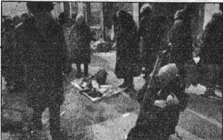
சோசலிசம் பழங்கதையாச்சு, வாழ்க்கை பழங்குப்பையாச்சு.

சந்தைப் பொருளாதார முறை என்பது தனியுடமை அதாவது தனியார் மூலதனம் - முதலீடு அடிப்படையிலானது. ஆனால் "நேற்று வரை" தொழில்களும் நிலமும் அரசு ஏகபோக உடமையாக இருந்த பொருளாதார அமைப்பில் திடீரென்று தனிவுடமையும் தனியார் மூலதன முதலீடும் எப்படி வந்தது? வரலாற்றில் முதலாளித்துவப் பொருளாதார அமைப்பு உருக் கொண்ட போது நிகழ்ந்த "மூலதனத்தின் ஆதிமுதல் திரட்சி" பற்றிய உண்மையை முதலாளித்துவப் பொருளாதார வல்லுநர்கள் மூடி மறைக்க முயன்றதைப் போலவே முன்னாள் சோசலிச நாடுகளில் தனிவுடமையும் தனியார் முதலீட்டிற்கான "மூலதனத் திரட்சியும்" எப்படி, எப்போது நிகழ்ந்தது என்பதைப் பற்றி வாய் திறவாமல் இருக்கின்றனர். "கம்யூனிசம் தோற்றுவிட்டது! முதலாளித்துவம் வென்றுவிட்டது" என்று அவர்கள் எக்காளமிடுவது உண்மையல்ல என்பதை இந்தக் கேள்விக்கான பதில் நிரூபிக்கிறது. அதற்கு மாறாக, கம்யூனிசம் ஒரு பின்னடைவைச் சந்தித்திருக்கும் அதே சமயம் - அந்தப் பின்னடைவும் இப்போது வந்ததல்ல; அறுபதுகளின் ஆரம்பத்தில் போலிக் கம்யூனிஸ்டுகள் ஆட்சியைப் பிடித்த போது நிகழ்ந்தது தான் - முதலாளித்துவ ஏகாதிபத்தியம் மேலும் சிக்கலான ஒரு நெருக்கடிக்குள் புகுந்துள்ளதுதான் உண்மையாகும்.