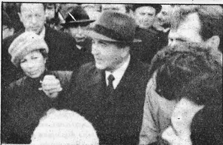
கோர்ப்பசேவ்: அதிகாரவர்க்க முதலாளித்துவத்தின் அவதாரம்.

பாட்டாளி வர்க்க சர்வாதிகார ஆட்சியை உள்ளிருந்தே சிதைத்து, அதிகாரத்தைக் கைப்பற்றிய முதலாளித்துவப் பாதையாளர்கள், முப்பது ஆண்டுகளாக அதிகார வர்க்க முதலாளித்துவ அமைப்பை நிறுவி ஆண்டு வந்தனர். அந்த நாடுகளில் பல்வேறு காரணங்களால் அந்த அதிகார வர்க்க முதலாளித்துவம் நீடித்திருந்தாலும் (சோவியத் ஒன்றியம் மற்றும் கிழக்கு ஐரோப்பிய நாடுகளில் 30 ஆண்டுகளாகவும், இன்னும் சீனா, வியத்நாம், கியூபா போன்ற நாடுகளில் 15 முதல் 20 ஆண்டுகளாகவும்) அதையே கூட அவை தக்க வைத்துக் கொள்வது அவ்வளவு எளிதானதாக இல்லை. மாசேதுங் சொன்னதைப் போல் வாய் கொள்ளாத அளவு பெரிய துண்டைக் கடித்துக் கொண்டு மெல்லவும் முடியாமல் விழுங்கவும் முடியாமல் விக்கித் துணறிப் போனார்கள்.