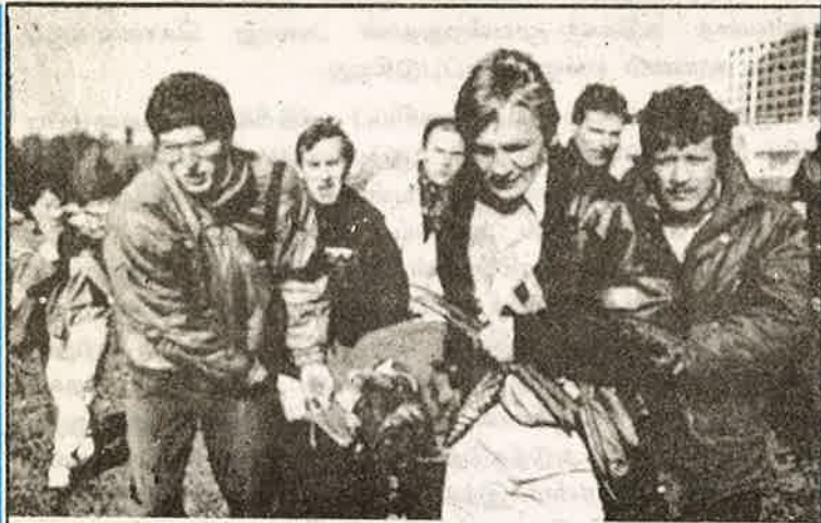
ரசியா: ஜனநாயக காற்றில் தப்பவில்லை தலைகள்.