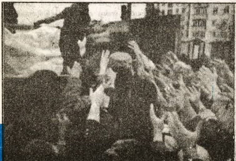
யெல்ட்சின் கும்பலுக்கு ஏகாதிபத்திய எலும்புத்துண்டு சமீப மக்களுக்கு ஜனநாயக ரொட்டித்துண்டு.