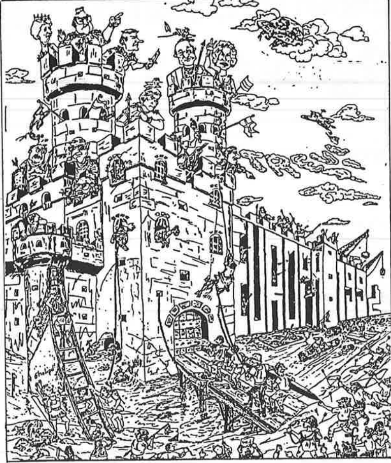
வெளியீடொன்று 1992 இன்பின்னான ஐரோப்பாவின் நுழையாயில்கள் இப்படித்தான் இருக்குமென சித்தரித்திருக்கிறது. (9th National Congress of Refugees and Immigrants)

நெதர்லாந்தின் மிகப் பெரிய போட்டி வங்கிகள் எ.பி.என். (ABN: Algemene Bank Nederland) அமெரோ (Amro: Amsterdam-Rotterdam Bank) ஆகியன ஒன்றாக இணைந்து தம்மைப் பலசாலி யாக்கியுள்ளன. ஜேர்மனியில் Nixdorf, Siemens உடன் இணைக்கப்பட்டுள்ளது. டென்மார்கில் மூன்று