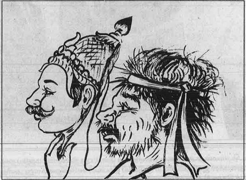
5090 உருபா மட்டுமே நிலுவையாய் நின்றுருக்கிறது!

ஆங்கிலேயருக்கு அவன் ஒழுங்கு மரியாதையாகக் கப்பம் கட்டி வந்துள்ளான் என்பதற்கு எல்லா சான்றுகளும் உண்டு. மக்களிடமிருந்து இவன் வரி தண்டலில்லை! மாறாக மக்களின் சொத்துக்களையும் வளங்களையும் கொள்ளையடிப்பதே அவன் தொழில். பக்கத்துப் பாலையங்களிலிருந்தும் கொள்ளையடித் திருக்கிறான். 31-05-1798 வரை அவன் ஆங்கிலேயருக்கு வைத்திருந்த நிலுவைத் தொகை 15,550 உருபா 19-9-1798 இல் சாக்சன் எனும் ஆங்கிலேய அதிகாரியின் உசாவல் நிகழ்கிற நேரத்தில் 10,460 உருபாக்களைக் கட்டிவிட்டு வெறும்