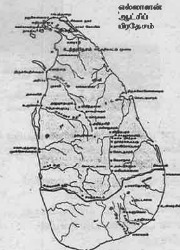
எல்லாளன் ஆட்சிப் பிரதேசம்