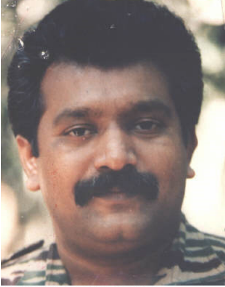
1994.9054 VELUPILLAI PRABHAKARAN

உமா மகேஸ்வரன் இவ்வாறு நடுத்தெருவில் வைத்து கொல்லப்பட்டிருந்தாலும் இதிலிருந்து சில வருடங்களுக்கு முன்னதாக இவர் மிக முக்கிய போராளிகளுள் ஒருவராகத் திகழ்ந்தவராவார்.