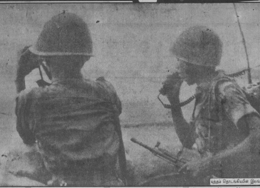
யுத்தம் தொடங்கியபின் இலங்கை இராணுவம்

'புலிகளும், தி.மு.க. அரசுக்கும் இடையே தெருங்கிய உறவு இருக்கிறது. தமிழ் நாட்டின் கடலோரப் பகுதிகள் விடுதலைப் புலிகளின் கட்டுப்பாட்டில் இருக்கின்றன' என்று ராஜீவ் குற்றம் சாட்டியதாக ஜூலை 23, 1990 அன்று அகில இந்திய வாசனாவீச் செய்தியில் தெரிவிக்கப்பட்டது. காங்கிரஸ் கட்சியின் காரியக் கமிட்டி கூட்டத்திலேயே மேற்படி குற்றச்சாட்டை ராஜீவ் காந்தி சுமத்தியிருந்தார். இதற்கிடையே இலங்கையில் இருந்து இந்தியா சென்ற நாடாளுமன்றத் துறங்கு ராஜீவ் காந்தியைச் சந்தித்தது. இந்தியாவில் இருந்து திரும்பிய பின்னர் சபாநாயகர் தலைமையில் பத்திரிகையாளர்கள் மாநாடு ஒன்றை அவர்கள் நடத்தியிருந்தனர். தாதுக்குழுவில் அன்றைய எதிர்க்கட்சித் தலைவர் அநுரா பண்டாரநாயக்காவும் சென்றிருந்தார். இந்தியப் படைக்கு எதிராக புலிகள் போரிட்டபோது, அவர்களைக் காட்டுக்குள் சென்ற சந்தித்தவர்களில் ஒருவர் அநுரா பண்டாரநாயக்காவார். இந்திய படையை வெளியேற்றுவது, இலங்கை, இந்திய ஒப்பந்தத்தை எதிர்ப்பது இரண்டும் சிறிதவள கனத்திற்கு உடன்பாடானதே என்றும் கூறியவர் அநுரா. இலங்கை, இந்திய ஒப்பந்தத்தில் கைசாத்திட்டு கொழும்பு வந்த ராஜீவ் காந்தியின் வருகையைப் புகழ்க்கின்றது சிறிதவள கனத்திற்கு உடன்பாடானதே என்றும் கூறியவர் அநுரா. இலங்கை, இந்திய ஒப்பந்தத்தில் கைசாத்திட்டு கொழும்பு வந்த ராஜீவ் காந்தியின் வருகையைப் புகழ்க்கின்றது சிறிதவள கனத்திற்கு உடன்பாடானதே என்றும் கூறியவர் அநுரா.