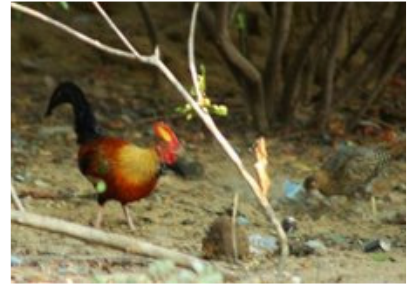
எனது பதிவுகள் 6