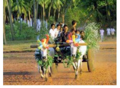
எனது பதிவுகள் 9