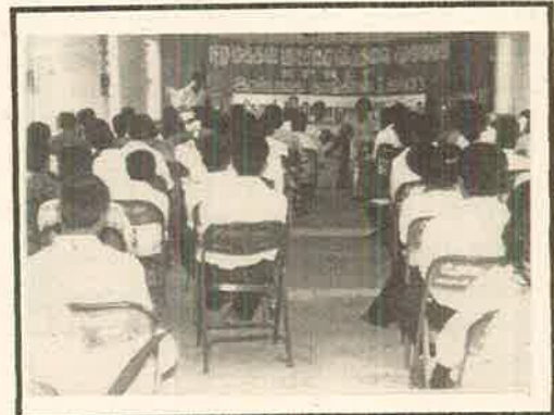
மத்தியகுழுசார்பில் செயலாளர்நாயகம் வாசிக்கும் ஸ்தாபன அறிக்கையை பிரதிநிதிகள் செவிமடுக்கின்றனர்.