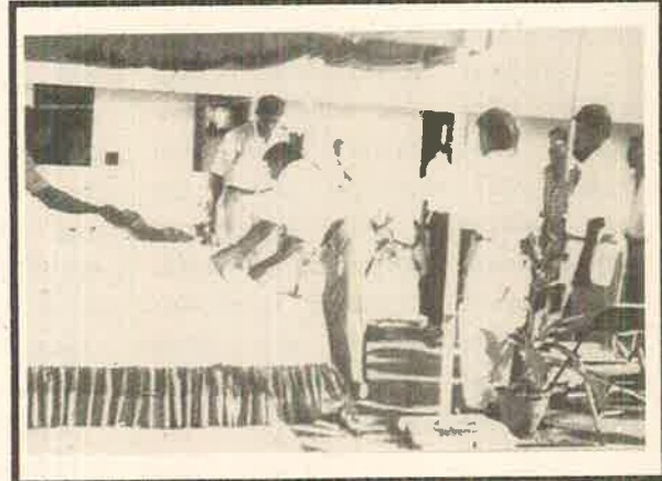
செயலாளர்நாயகம் மறைந்ததோழர்களுக்கு அஞ்சலிசெலுத்துகிறார்.