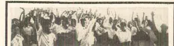
வாக்கெடுப்பில் காங்கிரஸ் பிரதிநிதிகள்.