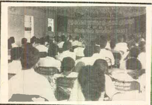
காங்கிரஸ் அரங்குள் பிரதிநிதிகளின் ஒரு பகுதியினர்.