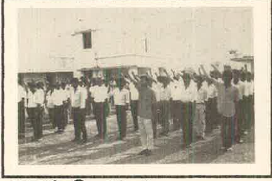
மறைந்ததோழர்கள் மறக்கப்பட்டவர்கள் அல்ல அவர்களின் இலட்சியங்களைத் தாங்கியபடி.....