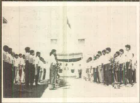
மறைந்ததோழர்களின் அஞ்சலிக்கு காங்கிரஸ் பிரதிநிதிகள்.