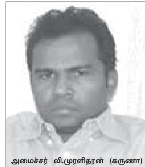
அமைச்சர் வி.முரளிதரன் (கருணா)

பல இடங்களில் இடம்பெயர்ந்து வாழ்ந்து வருபவர்கள் தொடர்பாக, இம் மாவட்டத்திலிருந்து இம் மாவட்டத்திற்குள் இடம் பெயர்ந்தவர்களினதும், இலங்கையிலிருந்து இந்தியாவிற்கு அகதியாக சென்று மீண்டும் இலங்கை வந்து மீள்குடியமர்ந்தவர்களினதும்,