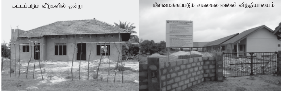
கட்டப்படும் வீடுகளில் ஒன்று

வீடுகள், சனசமூகநிலையங்கள், பாடசாலைகள், கோவில்கள் என கிராமமே தரைமட்டமாகிவிட்டது. வீடுகள் தோறும் சோலையாய் வளர்ந்து மக்களின் வாழ்வாதாரமாய் இருந்த தென்னை, பனை உள்ளிட்ட பயன்முனை மரங்கள் அனைத்தும் அழிக்கப்பட்டு யுத்தத்தின் கோர வடுக்களை, சுமந்து நின்ற கிராமம் இப்போது மீண்டும் புத்துயிர் பெற்றுக்கிறது. அதற்கு காரணமானவர்களை இவ்வாறு அம் மக்கள் விதந்து போற்றுவதில் வியப்பேதும் இல்லை.