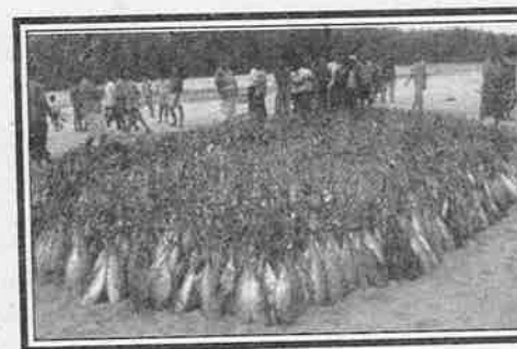
விலங்குகளின் அசாதாரண நடத்தைக்கும், இயற்கை அனர்த்தங்களின் முன்னறிவிப்பிற்கும் எப்போதும் தொடர்பு இல்லை அல்லது எப்போதும் தொடர்பு இல்லாமலும் இல்லை.

என்னைப் பொறுத்தவரை, இந்த அசாதாரண நடத்தை, சமீபகாலங்களில் உலகில் நடக்கும் சாதாரண நடத்தையில் ஒன்று என்று கருதிக் கொள்வது நன்று என நினைக்கின்றேன்.