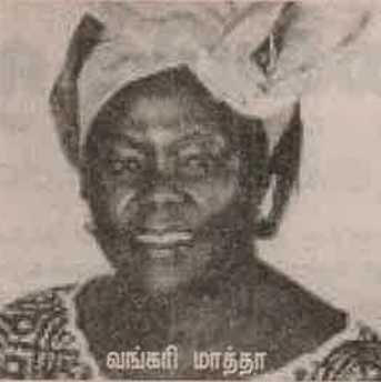
வ. வி. கி.