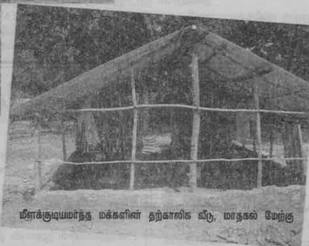
மீள்குடியமர்ந்த மக்களின் தற்காலிக வீடு, மாதகல் மேற்கு

நிகழ்ந்து முடிந்துள்ள, நிறைவேற்றி முடிக்கப்பட்டுள்ள முன்னேற்றங்கள் ஒரு புறமி