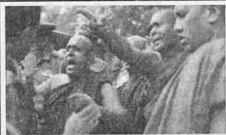
தம்புள்ளியில் பள்ளிவாசலை அகற்றிக் கோரி ஆர்ப்பாட்டம் 20 ஏப்ரல் 2012

மதகலாச்சார நம்பிக்கைகள் மீதும் நிர்ப்பந்தங்கள் ஏற்படுத்தப்பட்டுள்ளன.