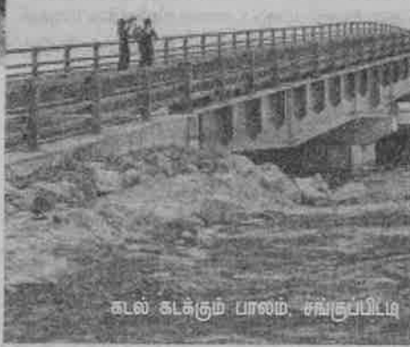
கடல் கடக்கும் பாலம் சங்குப்பிட்டி

ஆற்று ஓட்டங்கள் கடக்கும் பாலங்கள் நவீன தொழில் நுட்பங்களுடன் கட்டப்பட்டுள்ளன.