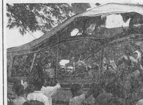
தம்புள்ளியில் பயணிகள் பஸ் மீது புலிகள் தாக்குதல் 18 பேர் பலி 02 பெப்ரவரி 2008

இலங்கையில் மீண்டும் மீண்டும் அறங்கள் அழிந்து வருகின்றன.