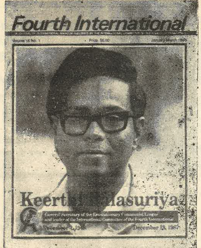
தடை செய்யப்பட்ட சஞ்சிகை, 1988 ஜனவரி-மார்ச் இதழ்

★ மாதமிகு இதழ் ★ இதழ் 387 ★ 1988 செப்டம்பர் 02 வெளிக்கிழமை