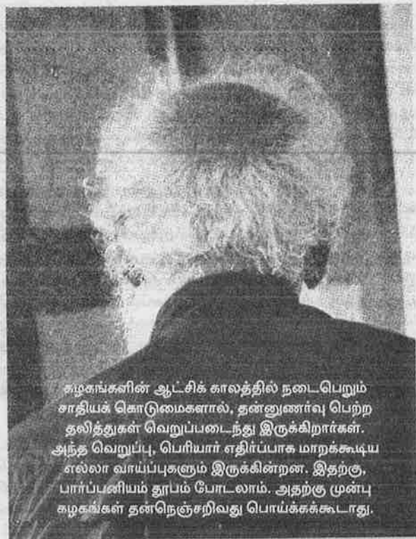
கழகங்களின் ஆட்சிக் காலத்தில் நடைபெறும் சாதியக் கொடுமைகளை, தன்னுணர்வு பெற்ற தலித்துகள் வெறுப்படைந்து இருக்கிறார்கள். அந்த வெறுப்பு, பெரியார் எதிர்ப்பாக மாறக்கூடிய எல்லா வாய்ப்புகளும் இருக்கின்றன. இதற்கு, பார்ப்பனியம் தூபம் போடலாம். அதற்கு முன்பு கழகங்கள் தன்னெஞ்சறிவது பொய்க்கக்கூடாது.