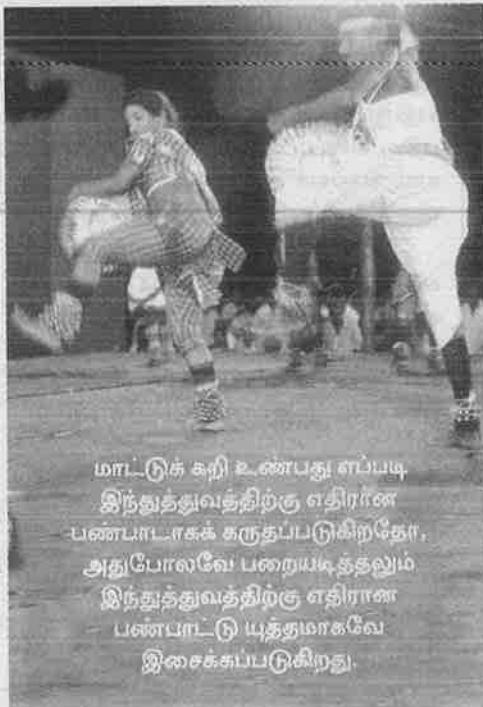
மாட்டுக் கறி உண்பது எப்படி இந்துத்துவத்திற்கு எதிரான பண்பாடாகக் கருதப்படுகிறதோ, அதுபோலவே பறையடித்தலும் இந்துத்துவத்திற்கு எதிரான பண்பாட்டு யுத்தமாகவே இசைக்கப்படுகிறது.

கள் - தலித் அல்லாதோரிடம் ஒரு சில அசைவுகளையும், மாற்றங்களையும் உருவாக்கியுள்ளன. தலித் கலைகளை ஏற்றுக் கொண்டு அவற்றைக் கற்றுக் கொள்ள முன்வந்துள்ளனர். இன்று தமிழகத்தில் தலித் அல்லாதோர் இக்கலைகளை கற்றுக் கொண்டு, கலைக் குழுக்களாகவும் இயங்கி வருகின்றனர். தலித் அல்லாதோரும் பறையடிக்கின்றனர். ஆனால், அவர்கள் சாவு நிகழ்வுகளுக்கு அடிப்பதில்லை. மேடை நிகழ்ச்சிகளில் மட்டுமே பறையடிக்கின்றனர். மேடை நிகழ்ச்சியைத் தொடர்ந்து, தொலைக்காட்சி, திரையரங்கம் போன்ற வெகுசன ஊடகங்களிலும் நிகழ்த்தி வருகின்றனர்.