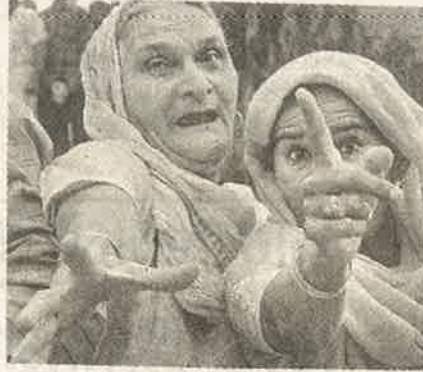
காவல்துறையின் விலங்காண்டித் தனத்தை எதிர்க்கும் பெண்கள்

“ கொடிய ஒடுக்குமுறைக்கு அஞ்சாத தொழிலாளிகளும் அவர்கள் குடும்பத்தினரும் - குறிப்பாகப் பெண்கள் வெளிப்படுத்தி வரும் போர்க்குணம், சுரண்டும் வர்க்கங்களுக்கும் அவர்களின் காப்பரண்களான மத்திய, மாநில அரசாங்கங்களுக்கும் கலக்கத்தை ஏற்படுத்தியுள்ளன. 99