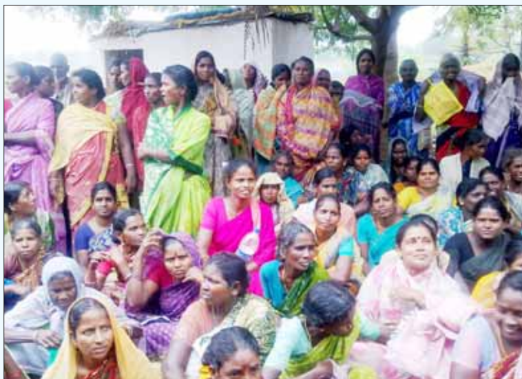
நிலப்பறிப்புக்கு எதிராக தேர்வாய் கண்டிகை கிராம மக்களின் உண்ணாவிரதப் போராட்டம்.

டயர் தொழிற்சாலை நிறுவப்பட்டால், பாசனத்துக்கான ஏரிகள் வறண்டு, ஆரணியாறு கழிவு நீரோடையாகக் குறுகிப் போய் விடும் என்று பாசனத்துறை அதிகாரிகளே தெரிவிக்கின்றனர். டயர் தொழிற்சாலையின் புகையாலும் கழிவுகளாலும் நிலத்தடி நீரும் சுற்றுச்சூழலும் கடுமையாகப் பாதிக்கப்படும். காடுகளும் மேய்ச்சல் நிலங்களும் அழிக்கப்படுவதால், கால்நடை வளர்ப்பை நம்பியுள்ள பின்தங்கிய நிலையிலுள்ள இப்பகுதிவாழ் மக்களின் வாழ்வாதாரங்கள் பிடுங்கப்பட்டு, அம்மக்கள் அகதிகளாக நேரிடும்.