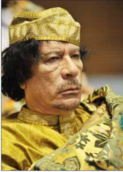
லிபியாவின் அதிபர் மும்மர் கடாஃபி.

தனது மேலாதிக்க நலன்களுக்காக சர்வாதிகாரிகளை அரவணைத்து வளர்த்து விடுவதும், அதே மேலாதிக்க நலன்களுக்காக அச்சர்வாதிகாரிகளைப் பதவியிலிருந்து தூக்கியெறிவது தொடங்கி பரலோகத்திற்கு அனுப்பி வைப்பது வரை அரசியல் சதுரங்க விளையாட்டுக்