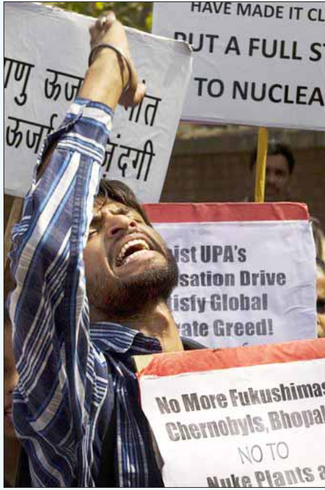
அணுமின் நிலையங்களை மூடக்கோரி டெல்லியில் நடந்த ஆர்ப்பாட்டம்.

விபத்து, ஏன், பாதாளக் குழியில் விழுந்துவிட்ட சிறுவனை மீட்கக் கூடத் தடுமாறி நிற்கும் இந்திய அரசு, அணு உலைகள் வெடித்தால் மக்களைப் பாதுகாப்பாக மீட்கும் என்பதற்கு எந்த உத்தரவாதமும் இல்லை. இந்தியாவில் உள்ள அணு உலைகளின் பாதுகாப்பு பற்றி சுயேட்சையான ஆய்வு எதுவும் இதுவரை செய்யப்படவில்லை. பத்தாண்டுகளுக்கு மேற்பட்ட அணு உலைகள் பாதுகாப்பற்றவை என்று ஏகாதிபத்திய நாடுகளே அவற்றை மூடிவிடும் நிலையில், தாராப்பூர் அணு மின் திட்டம் நிறுவப்பட்டு 40 ஆண்டுகளான பின்னரும் இன்னமும் பாதுகாப்பாக இருப்பதாக இந்திய அரசு புளுகி வருகிறது. 1993-இல் நரோரா அணு உலை தீ விபத்து, கைகா அணு உலையில் கோபுரம் வீழ்ந்த விபத்து, கல்பாக்கம் உள்ளிட்டு பல அணு உலைகளில் அடிக்கடி