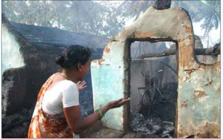
போலீசு பயங்கரவாதம்: காகரப்பள்ளியில் தீக்கிரையாக்கப்பட்ட விவசாயிகளின் வீடுகள்.

தங்களது வாழ்வுரிமை பறிக்கப்படுவதை எதிர்த்து விவசாயிகள் பலமுறை போராடிய போதிலும் மைய அரசோ, மாநில அரசோ அசைந்து கொடுக்காததால், அனல் மின் நிறுவனத்தின் வாகனங்கள் இப்பகுதியில் நுழைய முடியாதபடி விவசாயிகள் தடுப்பு அரண்களை அமைத்துப் போராட்டத்தை முன்னெடுத்துச் சென்றனர். ஈஸ்ட் கோஸ்ட் நிறுவனமோ, அரசிடம் முறையிட்டு கட்டுமானப்பணிகள் பாதிக்கப்படுவதால் தடையரண்களை அகற்றுமாறு கோரியது. அதைத் தொடர்ந்து, கடந்த பிப்ரவரி மூன்றாவது வாரத்தில் ஆயிரக்கணக்கான அதிரடி போலீசார் காகரப்பள்ளி