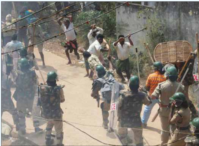
ஊரைக் கொளுத்திய போலீசுக்கு எதிராக காகரபள்ளி விவசாயிகளின் போராட்டம்.

இனி இவை எல்லாம் அம்மக்களுக்கு இல்லை. இந்த வனப்பகுதியில் சிறப்புப் பொருளாதார மண்டலம் அமைக்க 1127 ஏக்கர் நிலம் 2007-ஆம் ஆண்டில் தமிழக அரசின் சிப்காட் நிறுவனத்தால் கையகப்படுத்தப்பட்டது. இங்கு மெக்கெலின் எனும் பிரான்சு நாட்டு டயர் தொழிற்சாலை நிறுவப்படவுள்ளது. உலகெங்கும் 69 கிளைகளோடு ஆண்டுக்கு 1.9 கோடி பேருந்து, லாரி டயர்களை உற்பத்தி செய்யும் இப்பன்னாட்டு நிறுவனம் 2012-இல் முதற்கட்ட