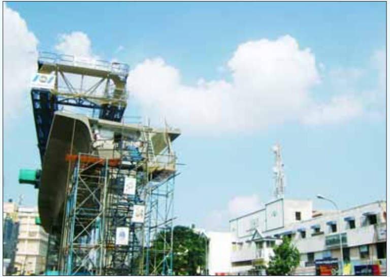
சென்னை மெட்ரோ ரயில் திட்டம்: ஆளுங்கட்சியின் சாதனையா? கார்ப்பரேட் கொள்ளைக்கான அடிக்கட்டுமானத் துறையின் வளர்ச்சியா?

போடப்பட்ட புரிந்துணர்வு ஒப்பந்தம் என்ன என்பதை தகவல் அறியும் சட்டத்தின் மூலமாகவும் அறிய முடியாது. இவை அனைத்தும் இரகசியமாக்கப்பட்டுள்ளன. அணுசக்தி ஒப்பந்தம் போல, இது நாட்டின் வளர்ச்சிக்கானது என்று கூறி மறைக்கப்படுகின்றன. குடிமக்களுக்கோ, சட்டமன்ற- நாடாளுமன்றப் பிரதிநிதிகளுக்கோ இவை தெரிய வேண்டியதில்லை என்பதுதான் அரசின் கொள்கையாக உள்ளது. மக்களால் தேர்ந்தெடுக்கப்படுவதாகக் கூறப்படும் நாடாளுமன்றத்திற்கோ, சட்டமன்றத்திற்கோ, உள்ளாட்சி அமைப்புகளுக்கோ