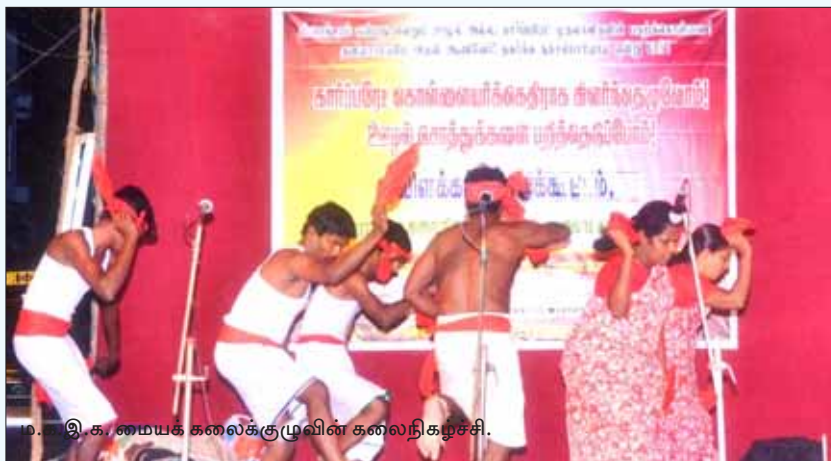
ம.க.இ.க. மையக் கலைக்குழுவின் கலைநிகழ்ச்சி.