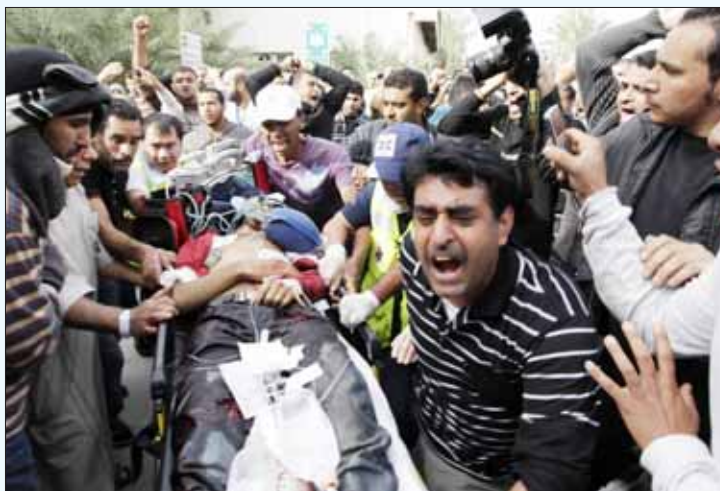
பஹ்ரைனில் மன்னராட்சிக்கு எதிராக நடந்து வரும் போராட்டத்தின் பொழுது போலீசார் நடத்திய தாக்குதலில் படுகாயமடைந்தவர் மருத்துவமனைக்குத் தூக்கிச் செல்லப்படுகிறார்.

மேற்குலக ஏகாதிபத்திய அரசுகள், லிபியா மீது பொருளாதாரத் தடையை விதிக்கின்றன. சொந்த நாட்டு மக்களை -ற்றுக்கணக்கில் கொண்டு குவிக்கும் கடாஃபியைக் குற்றவாளியாக அறிவித்து, சர்வதேச நீதிமன்றத்தில் வழக்கு தொடுத்திருக்கும் ஐ.நா. மன்றமும், அதன் உறுப்பு நாடுகளும், ஈராக்கிலும், ஆப்கானிலும் அமெரிக்காவும் நேடோ கூட்டணி நாடுகளும் நிராயுதபாணியான அப்பாவி மக்களைப் பத்தாயிரக்கணக்கில் கொண்டு குவித்து வருவதை வேடிக்கை பார்த்து வருகின்றன. இசுரேல் காசா முனையில் நடத்திய போர்க் குற்றங்கள் பற்றிய உண்மை அறிக்கையை ஐ.நா. மன்றத்தில் முன்வைக்கப்படுவதைத் தனது ரத்து அதிகாரம் மூலம் தடுத்து நிறுத்திய அமெரிக்கா, கடாஃபியின் கொலைக் குற்றங்கள் பற்றி முதலைக் கண்ணீர் வடிக்கிறது.