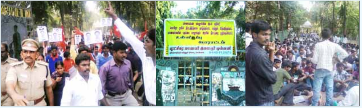
ஈழத் தமிழினப் படுகொலையைக் கண்டித்து நடந்த வகுப்புப்புறக்கணிப்புப் போராட்டம் (இடது); மெட்ரோ ரயில் திட்டத்திற்காக பச்சையப்பன் கல்லூரி நிலம் அபகரிக்கப்படுவதைக் கண்டித்து நடத்தப்பட்ட உள்ளிருப்புப் போராட்டம்.

இலங்கையில் இந்திய அரசின் ஆதரவோடு ராஜ பச்சே கும்பல் நடத்திய ஈழத் தமிழர் படுகொலையைக் கண்டித்தும், சென்னை - கிண்டியிலுள்ள செல்லம்மாள் மகளிர் கல்லூரி மாணவிகள் தமது உரிமைகளுக்காக நடத்திய போராட்டத்திற்கு ஆதரவு தெரிவித்தும், அனைத்து அரசு உதவிபெறும் கல்லூரி மாணவர்களுக்கும் இலவச பஸ் பால் வழங்கக் கோரியும் - இப்படிப் பல்வேறு பிரச்சினைகளுக்காக அரசை எதிர்த்துப் போராடியுள்ள இக் கல்லூரி மாணவர்கள், தற்பொழுது சென்னை நகரில் அமைக்கப்பட்டு வரும் மெட்ரோ ரயில் திட்டத்திற்காகத் தமது கல்லூரியின் நிலம் அபகரிக்கப்படும் அபாயத்தை எதிர்த்தும் போராடி வருகின்றனர். இவை மட்டுமின்றி, பச்சையப்பன் கல்லூரி மாணவர்கள் என்ற ஒரே காரணத்திற்காகவே தம்மிடம் அராஜகமாகவும் அநாகரீகமாகவும் நடந்துகொண்ட போலீசுக்கு எதிராகப் போராட்டங்களை நடத்தி, அப்படி நடந்து கொண்ட போலீசை மன்னிப்புக் கேட்க வைத்ததோடு, அப்போலீசாரைப் பணியிடை நீக்கமும் செய்ய வைத்தனர்.