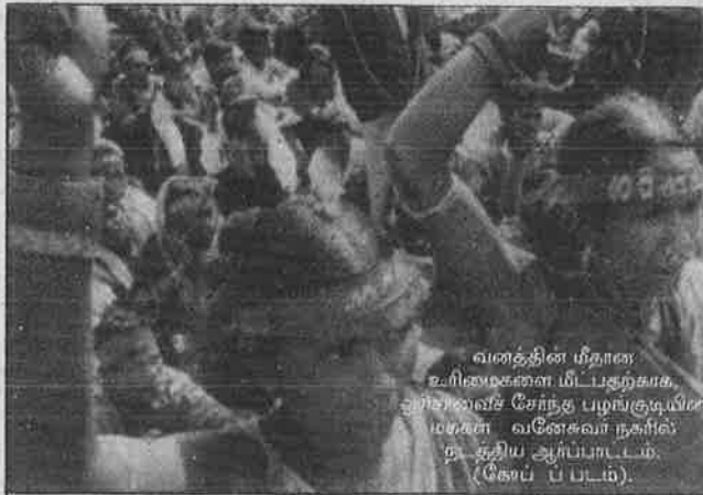
வணத்தின் மீதான உரிமைகளை மீட்பதற்காக, ஆந்திராவின் சேந்த பழங்குடியின மக்கள் வணைகவர்நகரில் தஞ்சிய அர்ப்பாட்டம் (கேள் பட்டம்).

குஜராத் மற்றும் மகாராஷ்டிரம் ஆகிய மாநிலங்களில் பாயும் நர்மதா மற்றும் அதன் துணை ஆறுகள் மீது சர்தார் சரோவர் அணைத் திட்டத்தின் கீழ் பல சிறிய-பெரிய அணைகள் கட்டி முடிக்கப்படும் நிலையில் உள்ளன. இதனால் பல இலட்சம் பழங்குடியின மக்கள் வெளியேற்றப்பட்டு சொந்த நாட்டிலேயே அகதிகளாக வாழ்கின்றனர். இந்த வெளியேற்றத்திற்கும், அணைத்திட்டங்களுக்கும் எதிராகவும், மறுவாழ்வு கோரியும் பல ஆண்டு