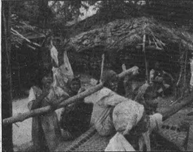
சத்புரா வனப்பகுதியில் இருந்து வெளியேற்றப்பட்டு, இந்திராநகரில் குடியமர்த்தப்பட்ட பழங்குடியின மக்கள் அடிப்படை வசதிகள்கூட இன்றி வரமும் அலவும்.

தற்போது மத்தியிலோ, மாநிலங்களிலோ ஏதாவது ஒரு வகையில் (தனித்தோ, கூட்டணிகளின் மூலமாகவோ) அரசில் பங்கேற்கும் அரசியல் கட்சிகள் இந்தச் சிறப்புப் பொருளாதார மண்டலங்களை முன்னிட்டு விவசாயிகளின் நில வெளியேற்றத்துக்குத் துணை போகும் சக்திகளாகவே உள்ளனர். அதேசமயம் தாங்கள் ஆட்சியில் பங்கேற்காத மாநிலங்களில் உள்ள பா.ஜ.க. போன்ற எதிர்க்கட்சிகள்; மகேந்திரா சிட்டி, போன்ற வற்றுக்கு துணைநின்ற ஜெயலலிதா; மத்திய அரசில் பங்கேற்று அன்புமணி மூலம் சிறப்புப் பொருளாதார மண்டலங்கள் நிறுவப்படுவதற்குத் துணை நிற்கும் பா.ம.க இராமதாசு; இப்போதைக்கு எதிர்த்தரப்பில் இருக்கும் மமதா பானர்ஜி போன்றவர்கள் விவசாயிகளின் நில வெளியேற்றத்தை எதிர்ப்பதாக நாடகமாடுகிறார்கள்.