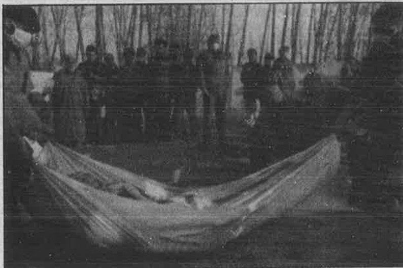
போலிமோதலில் சுட்டுக் கொல்லப்பட்டவரின் சடலம் மறுபிரேதப் பரிசோதனைக்காகத் தோண்டி எடுக்கப்படுகிறது.