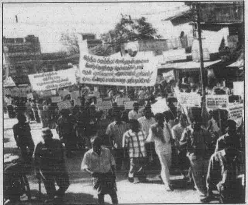
நகரெங்கும் விடுதலை மணம் பரப்பிய பேரணி