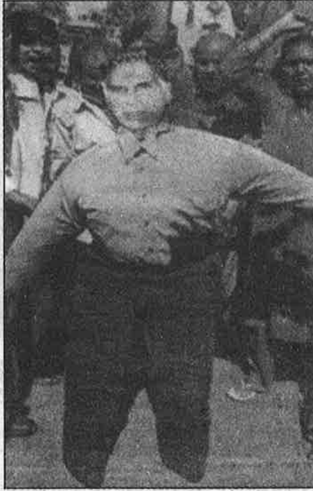
1984-ஆம் ஆண்டில், போபாலில் விஷவாயுப் படுகொலையை நடத்திய அமெரிக்க யூனியன் கார்பைடு நிறுவன வளாகத்தில் படிந்து போயிருக்கும் நச்சுக் கழிவுகளை, "டோ கெமிக்கல்ஸ்" என்ற அமெரிக்க நிறுவனத்திற்குப் பதிலாக, டாடா நிறுவனம் அகற்ற ஏற்பாடு நடந்து வருகிறது. தனது பொறுப்பைத் தட்டிக்கழிக்கும் "டோ கெமிக்கல்ஸ்"க் காப்பாற்றத் துடிக்கும் டாடாவின் பாதநடவாங்கித்தனத்தைக் கண்டித்து, போபால் நகர உழைக்கும் மக்கள் கடந்த பிப்.4-ஆம் நாளன்று நடத்திய டாடா கொடும்பாவி எரிப்புப் போராட்டம்.

உலகமயமாக்கத்தின் கீழ் தரகு முதலாளிகளின் தன்மையிலும் செயல்பாட்டில் பரிணாம மாற்றங்களே இருக்காது; அவர்கள் வெளிநாடுகளில் முதலீடு செய்யவோ ஏகாதிபத்திய நிறுவனங்