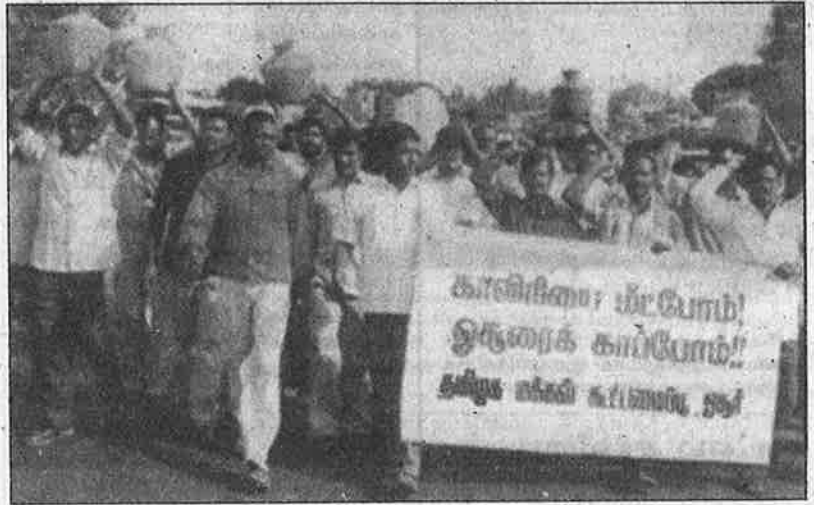
இறுதித் தீர்ப்பைக் கண்டிக்கும் சாக்கில் கர்நாடக போலீசின் பாதுகாப்போடு, தமிழக எல்லைக்குள் அத்துமீறி நுழைந்து ஆர்ப்பாட்டம் நடத்தும் கன்னட ஜாக்குருதி வேதிகா அமைப்பினர் (மேலே); அதற்கு எதிராகக் கர்நாடக எல்லைக்குள் நுழைந்து, தமிழினவாதிகளால் நடத்தப்பட்ட ஊர்வலம்.

திற்கு ஒதுக்கப்பட்டுள்ளது. இதன் மூலம், தமிழகத்திற்குத் தற்காலிகமாக 2,000 முதல் 2,500 கோடி கன அடி நீர் கூடுதலாகக் கிடைக்கும் வாய்ப்பு ஏற்பட்டுள்ளது.