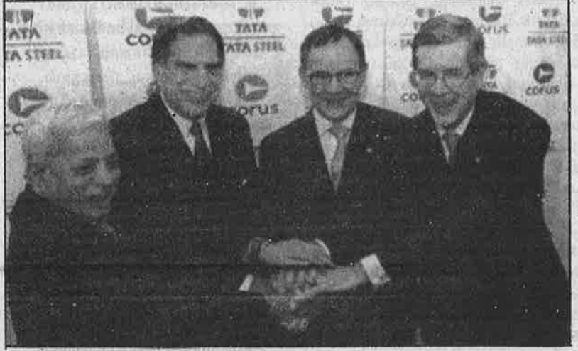
கூட்டிணைவைக் கொண்டாடும் டாடா-கோரஸ் நிறுவனங்களின் முதலாளிகளும் நிர்வாகிகளும்.

மூலதனம் உலகமயமாகியிருப்ப தும், மூலதன ஒன்று குவிப்பை அடிப்படையாகக் கொண்ட தேசங் கடந்த தொழில் கழகங்களும் நிதி மூலதன வங்கிகளும் புதிய ஏகபோகங்களாக வளர்ந்திருப்பதும் ஏகாதிபத்திய சகாப் தத்தின் புதிய கட்டத்தை உணர்த்துகின்றன. இதன்படியே, பல்வேறு நாடுகளில் தொழிற்கூட்டுகளும், கைப்பற்று தல்களும் மறுகூட்டுகளும் போட்டா போட்டிகளும் வேகமாக நடக்கின்றன. இவையெல்லாம் ஏகாதிபத்திய நாடுகளில்தான் நடக்கும்; ஏழை நாடுகளின் தரகுப் பெருமுதலாளிகள் அத்தகைய போட்டா போட்டிகளில் ஈடுபடவே மாட்டார்கள் என்பதல்ல. இந்தியாவின் டாடாவும் பிரிவாவும் நிலையன்சும் இத் தகைய போட்டா போட்டிகளில் ஏற்கெ னவே இறங்கியுள்ளதோடு, வெளிநா டுகளில் முதலீடு செய்தும் அந்நாடு களது பெருந்தொழில் நிறுவனங்க ளைக் கைப்பற்றவும் செய்துள்ளனர். அதேபோல, ஏழை நாடான பிரேசி லின் சி.எஸ்.என்; தென்கொரியாவின் சாம்சங், ஹூண்டாய், இந்தோனேஷி