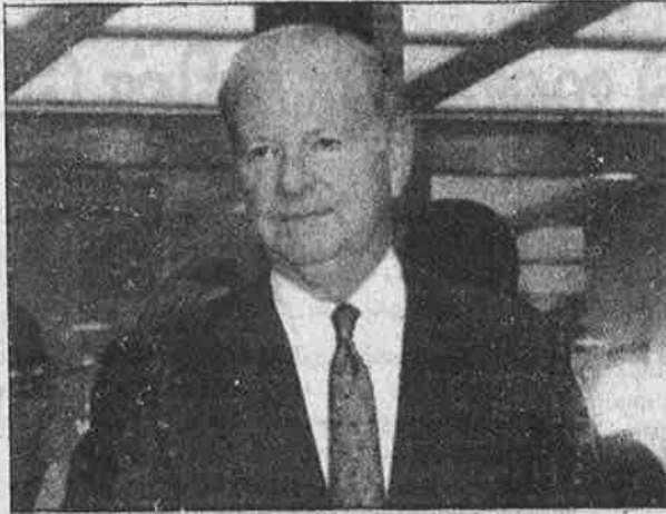
இரகசிய சதிகளுக்காக இந்தியாவுக்கு வந்த முன்னாள் அமெரிக்க அரசு செயலாளர் ஜேம்ஸ் பேக்கர்.

வேலைகளில் ஈடுபட்ட உள்ளதால், அதில் இந்திய அரசு மற்றும் தனியார் நிறுவனங்கள் பங்குதாரர்களாகக் கூட்டுச் சேர வேண்டும். ஈராக்குடனான வர்த்தக உறவுகளை இந்தியா விரைவில் துண்டித்துக் கொள்ள வேண்டும் - என்று ஜேம்ஸ் பேக்கர் தமது இரகசிய பேச்சு வார்த்தையில் எச்சரிக்கை விடுத்துள்ளார். ஈராக்குடன் பாரம்பரியமாக வர்த்தக உறவு வைத்துள்ள இந்தியா, என்ன செய்வது என்று புரியாமல் கையைப் பிசைந்து கொண்டிருக்கிறது.