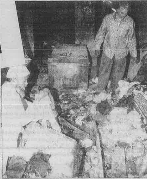
இந்துவெறி பாசிசக் கோரத் தாண்டவம்: தீயிட்டுக் கொளுத்தப்பட்ட தமது துணி கிடங்கில் ஏதாவது தேறாமா என்று வேதனையுடன் தேடும் முசுலீம்கள்.

இந்து வெறியர்களின் அட்டுழியங்களைக் கண்டித்து இடதுசாரி அமைப்புகளும் மக்கள் உரிமை இயக்கங்களும் அறிக்கை வெளியிட்டு, பாதிக்கப்பட்ட பகுதிகளுக்கு நேரில் சென்று சௌதாலா அரசின் யோக்கியதையை அம்பலப்படுத்தியதும், சௌதாலா அரசு இப்போது நீதி விசாரணைக்கு உத்திரவிட்டு ஒருசில இந்து வெறியர்களைக் கைது செய்துள்ளது. இக்கண் துடைப்பு நடவடிக்கையைக் கூட ஏற்க மறுத்து இந்து வெறியர்கள் ஆர்ப்பாட்டங்களை நடத்தி வருகின்றனர். இந்துவெறி பாசிசடுகள் நாடெங்கும் கோரத் தாண்டமாய்போதியும், பதவி சுகத்தில் திராவிடக் கட்சிகள் நாடாளுமன்றத்தில் வாய்மூடிக் கிடப்பதோடு வெட்கமின்றி பா.ஜ.க. அரசுக்கு முட்டுக் கொடுத்துக் கொண்டிருக்கின்றன.