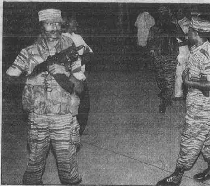
போர் நிறுத்தத்தின் பின்னும் கலைக்கப்படாத புலிகளின் இராணுவம் மற்றும் போலீசு: வடக்கு - கிழக்கு பகுதிகளின் அதிகாரம் புலிகளின் கைகளுக்கு வந்துவிட்டதற்கான சாட்சிகள்.

1990களின் மத்தியிலேயே, சிங்கள ஆளும் வர்க்கத்தினர் பிளவுபட்டு, ஈழப் போரை நிறுத்தவும், அமைதி வழித் தீர்வு காணவும் பெரும்பாலான சிங்கள மக்கள் ஆதரவும் ஏற்பட்டுவிட்டது. இதைப் பயன்படுத்திக் கொண்டுதான் நாடாளுமன்ற, அதிபர் தேர்தல்களில் சந்திரிகா தலைமையிலான மக்கள் கூட்டணி வெற்றி பெற்றது. "இனப் பிரச்சினைக்கு சமாதானத் தீர்வு" என்கிற வாக்குறுதிக்குத் துரோகமிழைந்த சந்திரிகா அரசு மீண்டும் இன ஒடுக்கு முறைப் போரைத் தொடுத்தது.