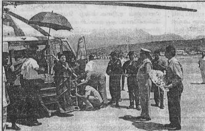
கஜானா காலியானாலும் தனது ஆடம்பரத்தைக் குறைத்துக் கொள்ளாமல், ஆண்டிப்பட்டியில் ஹெலிகாப்டரில் வந்திறங்கும் ஜெயா.