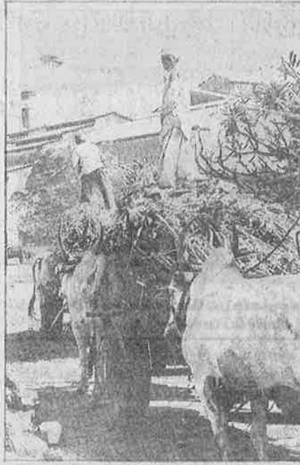
ஆலையருகே ஒரு வாரத்துக்கு மேலாகக் காத்திருந்து கூட்டுறவு சர்க்கரை ஆலைக்குள் செல்லும் விவசாயிகளின் கரும்பு வண்டிகள்.

கிராமப்புற கூலி - ஏழை விவசாயிகள் பட்டினி கிடந்து பரிதவிக்காமல் ஒரு வேளை கஞ்சியாவது குடிப்பதற்காக அரசாங்கத்தால் முன்பு செயல்படுத்தப்பட்ட வேலை உத்தரவாதத் திட்டம், தனியார்மயம் - தாராளமயம் நடைமுறைப்படுத்தப்