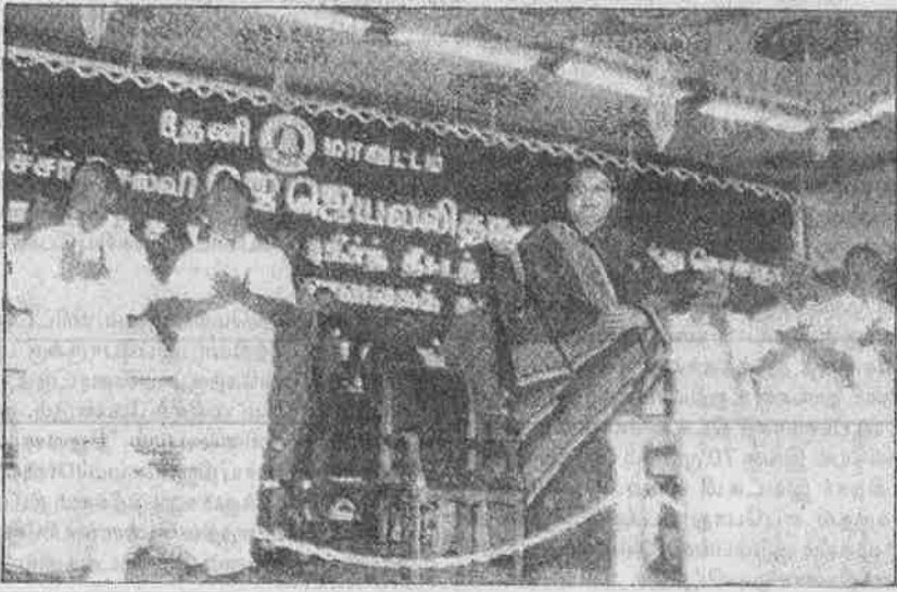
ஆண்டிப்பட்டி தொகுதியில் கூட்டுக் குடிநீர் திட்டத் தொடக்க விழா: தனியார்மயக் கொள்ளைக்கு கால்கோள் விழா.