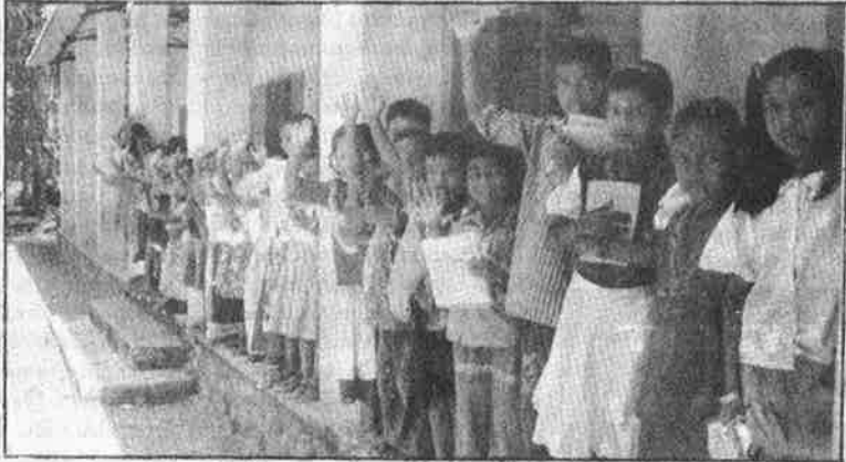
கேரளத்தின் தாலத்தக்காவு கிராமத்தில் மூடப்பட்ட பழங்குடியின ஆரம்பப்பள்ளி: உலக வங்கி உத்தரவுப்படி நிரந்தர விடுமுறை.

பிற மாநிலங்கள் ஏழைக் குழந்தைகளின் கல்வியறிமையைப் பறிக்கும்போது, நாங்கள் அதற்குச் சற்றும் சளைத்தவர்கள் அல்ல என்கிறது தமிழகம். ஆதிதிராவிடர் மாணவர் விடுதிகளை நடத்த நிதியில்லை என்று அவற்றைத் தனியாரிடம் கையளிக்க தமிழக அரசு அண்மையில் முடிவு செய்துள்ளது. 1017 ஆதிதிராவிடர் நலப் பள்ளிகளையும் 243 பழங்குடியினருக்கான பள்ளிகளையும் ஆதிதிராவிடர் நலத் துறையிடமிருந்து பிடுங்கி கல்வித் துறையிடம் ஒப்படைக்கவும் திட்டமிட்டுள்ளது. உலகவங்கியின் கட்டளைப்படி தாழ்த்தப்பட்டோருக்கான நிதி ஒதுக்கீட்டை வெட்டி, இந்த தடாவிட முடிவை தமிழக அரசு அறிவித்துள்ளது.