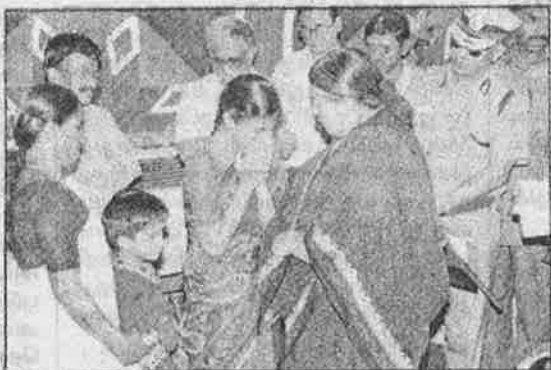
சங்கரலிங்கபுரத்தில் போலீசுக்காரர் மனைவிக்கு ஆறுதல் கூறும் ஜெயா: தலித்துகளின் கண்ணீரைத் துடைப்பதாகப் பம்மாத்து.