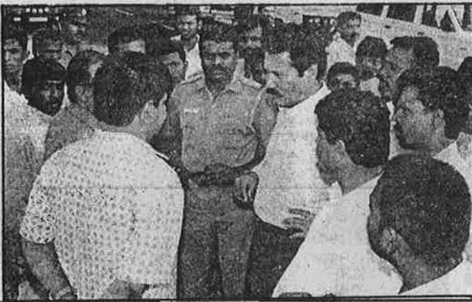
புதிய தமிழகம் தலைவர் கிருஷ்ணசாமி நாட்டாமங்கலத்தில் நுழைவதற்கு முட்டுக்கட்டை போடும் அதிகார வர்க்கம்.

நிலமும் அதிகாரமும் எனும் இவ்விரு கோரிக்கைகளை தேர்தல் பாதையும் நாடாளுமன்ற சனநாயகமும் அனுமதிக்காது. தேர்தலைப் புறக்கணிக்கும் நச்சல்பாரி புரட்சிகரப் பாதையில்தான் இந்தக் கோரிக்கைகளை அடைய முடியும். ஆனால், விடுதலைச் சிறுத்தைகள், புதிய தமிழகம் போன்ற 'தலித்' அமைப்புகளோ, "தேர்தல் பாதையின் மூலமே தாழ்த்தப்பட்டோர் அதிகாரத்தை அடைந்து விட முடியும்" என்ற சமரசப் பாதையில் தாழ்த்தப்பட்டோரை வீழ்த்தித் துரோகமிழைக்கின்றன.