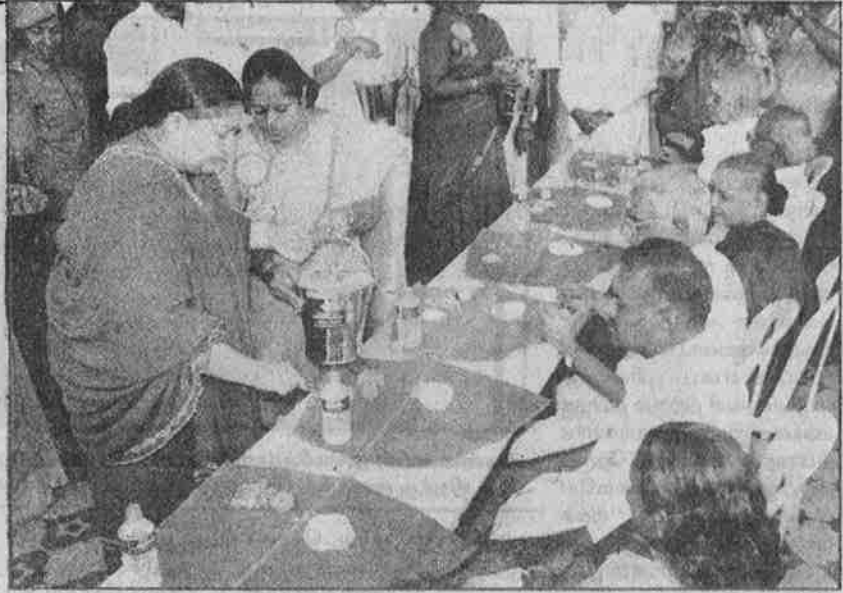
மக்களின் வரிப்பணத்தில் சென்னை - கபாலீசுவரர் கோயிலில் ஜெயா நடத்திய தட்டில் அன்னதான விழா.

★ ரேசன் அரிசிக்கு வழங்கப்படும் மானியத்தில், கடந்த ஆண்டை விட இந்த ஆண்டு 300 கோடி ரூபாய் குறைக்கப்பட்டுள்ளது. இந்த மானிய வெட்டோடு, தமிழக அரசு வழங்கவுள்ள கூப்பன்களை வைத்திருக்கும் ஏழைகளுக்கு மட்டும் தான் ரூ. 3.50 ரேசன் அரிசி வழங்கப்படும் என்றும் ஜெயா அரசு அறிவித்துள்ளது. இதன் மூலம், ரேசன் கடைகளில் ரூ. 3.50-க்கு அரிசி வாங்கி வரும் ஏழைகளின் எண்ணிக்கையைக் குறைத்துவிடச் சதித்தனமாக முயலுகிறது, ஜெயா கும்பல்; பட்ஜெட்டில் ரேசன் அரிசியின் விலையை உயர்த்தாமல் விட்டதைக் காட்டி இந்த தகி