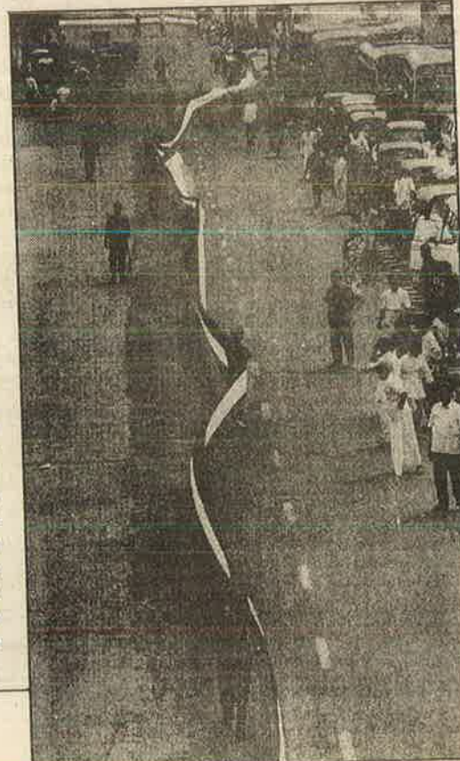
தி.மு.க.வின் 'தேசிய' விசுவாசத்தைப் பறைசாற்றும் 1050 மீட்டர் நீளமுள்ள தேசியக் கொடியின் ஒரு பகுதி.

அறிவிக்க கள், ளுக்கு யில் ளுக்கு 75 செய் கல் ஏம திய ள