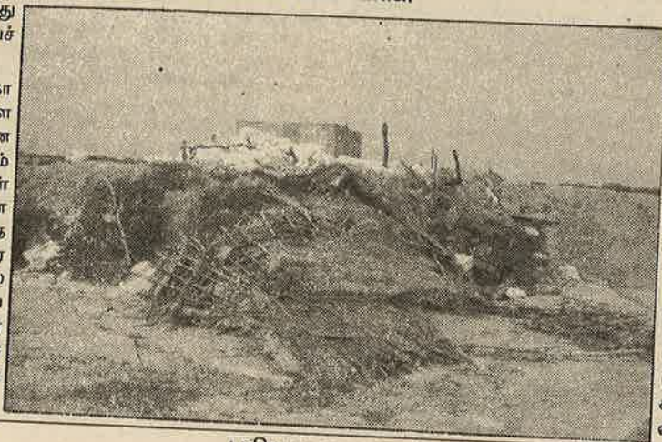
வாய்மேடு விவசாயிகளால் அடித்து நொறுக்கப்பட்ட இறால் பண்ணைக் கொட்டகை.

இதற்குப் பதிலடியாக ம.க.இ.க. சார்பில் இவர்களின் சட்ட விரோதச் செயல்களை அம்பலப்படுத்திய துண்டுப் பிரகரங்கள் தஞ்சை, நாகை, திருவாரூர் மாவட்ட மக்களிடையே வினியோகிக்கப்பட்டது. உச்சநீதி மன்றம் தடை செய்த பின்பும் இறால் பண்ணை அமைக்க முயன்றது நீதிமன்ற அவமதிப்பு. 1995-ஆம் ஆண்டு தமிழ்நாடு நீர்வாழ் உயிரின வளர்ப்பு (முறைப்படுத்தல்) சட்டப் பிரிவு 3, உட்பிரிவு (7), (2.சி)யின் படி பபிரிடும் நிலங்களை பயன்படுத்தக் கூடாது என்பது மீறப்பட்டுள்ளது.