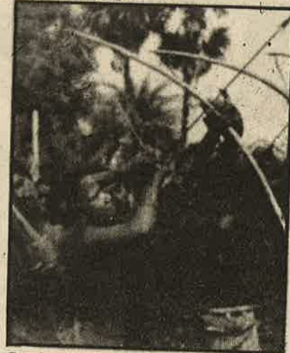
இழந்த நிலத்தை மீட்க மரபுவழி ஆயுதங்களுடன் கோயா மக்கள் நடத்தும் ஆர்ப்பாட்டம்

இந்தியச் சந்தையை தேசங்கடந்த தொழிற் கழகங்களுக்கு இலாகாகத் திறந்துவிட வேண்டுமென் அமெரிக்கா தலைமையிலான ஏகாதிபத்திய நாடுகள் உலக வர்த்தக நிறுவனம் (WTO) மூலம் புதிய மிரட்டல்களை அண்மையில் விடுத்துள்ளன. கடந்த ஜூன் மாதம் ஜெனீவாவில் நடந்த உ.வ. நிறுவனக் கூட்டத்தில் இறக்குமதி தொடர்பான அளவு ரீதியான கட்டுப்பாடுகளை இந்தியா முற்றாக நீக்க வேண்டுமென அமெரிக்கா, ஐரோப்பிய ஒன்றிய நாடுகள், ஆஸ்திரேலியா, கனடா, கவிட்சா லாந்து மற்றும் நியூஜிலாந்து ஆகிய நாடுகள் முறையிட்டன. இதற்கு 9 ஆண்டு கால அவகாசமும் பின்னர் 6 ஆண்டு கால அவகாசமும் தருமாறு இந்தியா கெஞ்சிப் பார்த்தும் இந்நாடுகள் ஏற்கவில்லை.