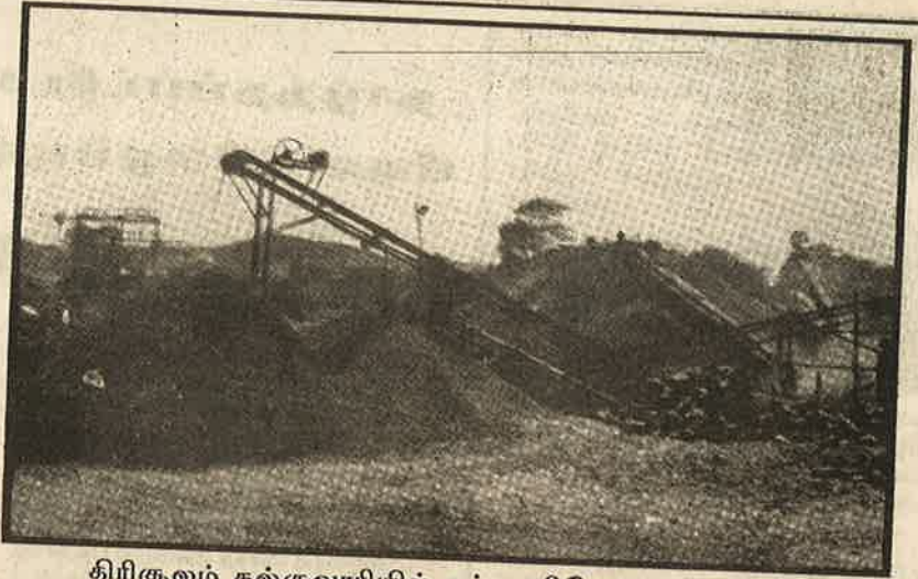
திரிகுலம் கல்குவாரியில் சட்ட விரோதமாக நடக்கும் கல் உடைப்புத் தொழில்

வான இயக்கத்தினரும் விவசாயிகளும் இறால் பண்ணைகளை அழிக்கும் போராட்டத்தில் இறங்கியுள்ளனர்.