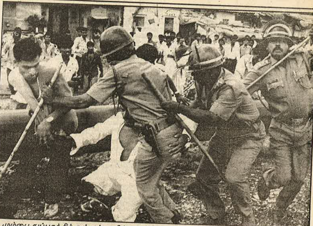
மும்பை துப்பாக்கிச் சூட்டில் பாதிக்கப்பட்ட மக்களுக்கு ஆறுதல் கூற வந்த அத்வாவே, தாழ்த்தப்பட்ட இளைஞர்களால் ஓட ஓட வீரட்டித் தாக்கப்பட்டார்: தாழ்த்தப்பட்ட மக்களை வெறும் ஏணியாகக் கருதும் தாழ்த்தப்பட்ட தலைவர்கள் உஷார்!

கீழ் ஒன்று திரட்ட முடியவில்லை. தனது அமைப்பின் சமூக அடித்தளத்தை விரிவாக்கிக் கொள்ளவே, அம்பேத்கர் இந்தியக் குடியரசுக் கட்சியைத் துவக்கினார். ஆனாலும், மகாராஷ்டிராவில் வாழும் சம்பர், மாதங்க் சாதியினர் அம்பேத்கரைப் பின்பற்றவில்லை. மகர் சாதியினரிலும் புத்த மதத்துக்கு மாறிச் சென்றவர்களும், நடுத்தர வர்க்கப் பிரிவினரும் தான் அக்கட்சியில் பெரும்பாலும் உறுப்பினர்களாக ஆதரவாளர்களாக இருந்து வருகின்றனர். இன்று அக்கட்சி, தலைவர்களின் சுயநலன் - பதவி ஆசையால் நான்காகப் பிரிவுபட்டுப் போயுள்ளது.