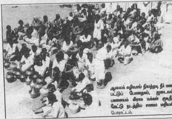
ஆலைச் சுழிவு நீர் நிலத்தடி நீர் மூட்டுப் போராட்டம், ஜடையம்பாளையம் கிராம மக்கள் குடிநீர் வேட்டு உத்திய சண்டை மறியல் போராட்டம்.