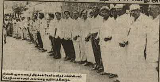
சென்னை தொழிலாளர் கூட்டம் போராட்டம்

ஆலையைத் திறக்கக் கூறிய நீதிமன்ற உத்தரவோ குப்பைக் கூடையில். முதல்வர் முன்னிலையில் போட்ட ஒப்பந்தமும் கழிப்பறைக் காசிதமாயின. சாராயம் காய்ச்சும் கிரிமினல் கும்பலுக்கு ஆலை நிர்வாகமும் தெரியாது; ஆயிர மாயிரம் தொழிலாளர்களின் ஆற்றலும் தெரியாது.