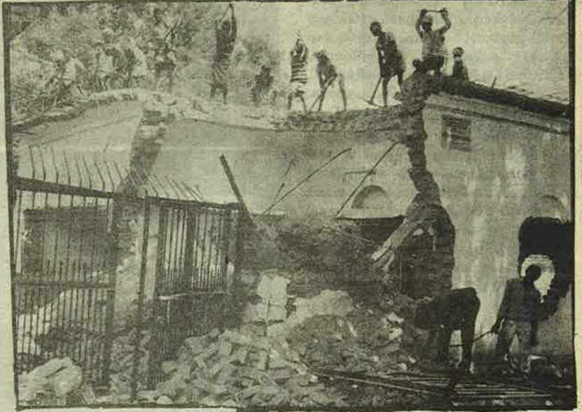
150 ஆண்டுகளுக்கு முந்தைய சக்ஷிகோபால் கோயில் இடிப்பு; கூலியாட்களைக் கொண்டு இந்து வெறியர்கள் நடத்திய கடப்பாறை சேவை.

ஆயிரக்கணக்கான உளவுத் துறை போலீசாரையும், "ரா", "சி.பி.ஐ.", "ஐ.பி."