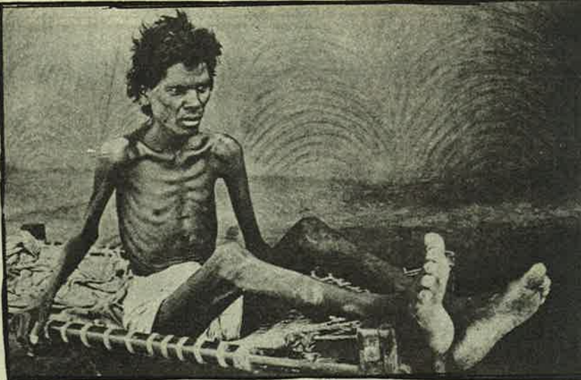
ராஜீவ் ஆட்சியிலும் பட்டினி; ராவ் ஆட்சியிலும் பட்டினி. நடை பிணமாகிவிட்ட கலாகாந்தி விவசாயி.

தொடர்ச்சியாக அம்பலப்பட்டு போவதாலும், மக்களின் எதிர்ப்பை சம்பாதித்துக் கொள்ள விரும்பாமலும் ஆள்பவர்கள் மறைமுகமாக பட்டினிச் சாவை அங்கீகரித்து நிவாரணப் பணிகளை அறிவித்து ஏய்க்கிறார்கள். பட்டினிச் சாவுகள் கலாகாந்தியில் நடந்து சந்தி சிரித்ததும் பல வறட்சி நிவாரணத் திட்டங்களை அறிவித்து பஞ்சப் பகுதி இனி பசுமைப் பகுதியாகிவிடும் என ஜவ் வித்தைக் காட்டினர். வறட்சி பாதித்த பகுதிகளான திட்டம் (DPAP) வறுமை ஒழிப்பு - வளர்ச்சி பணிக்கான பகுதி (ADAPT), கிராமப்புற ஏழைகளின் பொருளாதாரத்தை புணரமைக்கும் திட்டம் (ERRP), மலைவாழ்