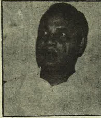
ஜெயா மிரட்டலுக்கு பயந்து காங்கிரசு வெளியேற்றிய சுப்பு

ஆனால் மகா மகம் பற்றி தன்னிலை விளக்கம் தரவும், மற்றவர்கள் மீது பழிபோ டவும், சாபம் விடவும் ஜெயவலிதா மற்றும்