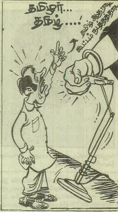
என்று அக்கும்பல் முடிவு செய்து அவற்றின் மீதும் பாய்கிறது.

பத்திரிகைகள் மீது பாய்ச்சல்! பார்ப்பன எடுகளும் பதற்றம்! பார்ப்பன - பாசிச ஜெயா கும்பலின் அக்கிரமங்களை வெளியில் தெரியாமல் இருக்க வேண்டுமானால் எதிர்க்கட்சிகளை ஒடுக்கினால் மட்டும் போதாது, பத்திரிகைகளுக்கு வாய்ப்பூட்டுப் போடவேண்டும்