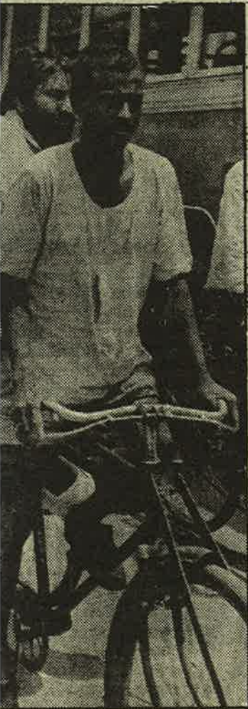
பின் காட்டுமிராண்டித்தனம் "உருளை" சித்திரவதைக்குப் பணியில் குற்றயிராய் கிடக்கும் பாம்புகளார். விசாரணைக் கைதியைக் பேர் போலீசு.

1991 ஜனவரி வரை பட்டிகளில் 415 பேர் கொல் நீதி. இந்தியாவின் 25 மாநி ல்கள் மற்றும் ராணுவத்தால் சித்திரவதைகளும் கொலை நிகழ்ச்சிகளாகிவிட்டன. காஷ்மீர் மாநிலங்களில் புகள் ராணுவத்தின் ஒழுங் பட்டது.