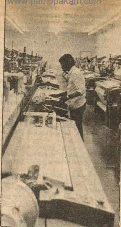
பலகோடி நெசவுத் தொழிலாளிகளை பட்டினிச் சாவுக்குத் தள்ளிவிட்டு, தரகு அதிகார முதலாளிகளின் வளர்ச்சிக்கு நவீனப்படுத்துகிறார்கள்

ஒரு கோடிப்பேருக்கும் மேலாக கைத்தறி தொழிலாளர்கள் நெருக்கடியால் தரித்திர நிலைக்குத் தள்ளப்பட்டு விட்டார்கள். விசைத்தறிக்கு மாறி விடுகிறோம்; கடன் கொடுங்கள் என்று கைத்தறி முதலாளிகள் பாசிச குடும்பலீடம் கெஞ்சியும் கூட கையில் காசிருந்தால் மாறிக் கொள்ளுங்கள் என்று