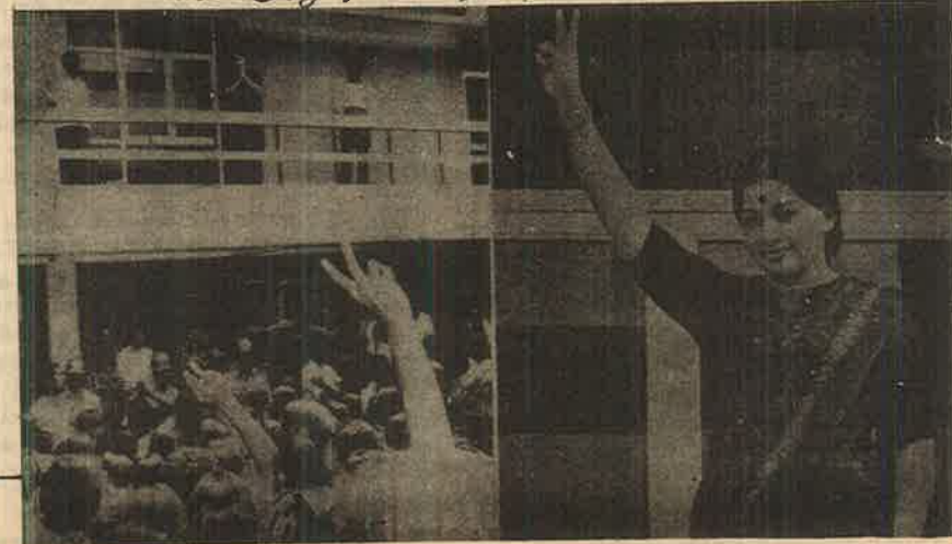
பொறுக்கி அரசியலின் தமிழக கிதாநாயகி; கிதாண்டர்நாளுக்கு பாலகனிபலிருந்து தரிசனம் தருகிறார்.

பிற்போக்கு சித்தாந்தங்களை வெளிப்படையாக வைத்து பரந்து பட்ட மக்களை இனிமேலும் ஈர்க்க முடியாது என்கிற அரசியல் ஓட்டாண்டித்தனம் தேர்தல் அரசியல் கட்சிகளுக்கு ஏற்படுகின்றன.