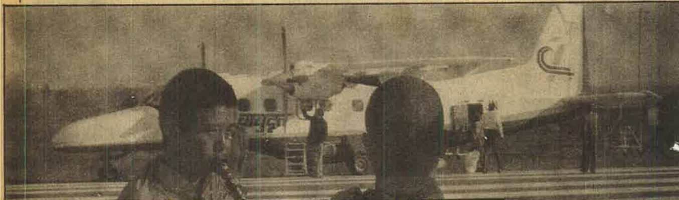
இதுதான் இன்றைய இந்தியா

இந்த உதவாக்கரை, ஊதாரி ஆட்சி முறையை இன்னும் எத்தனை காலம்தான் கழுத்தொடிய சுமந்து கொண்டிருப்பது?