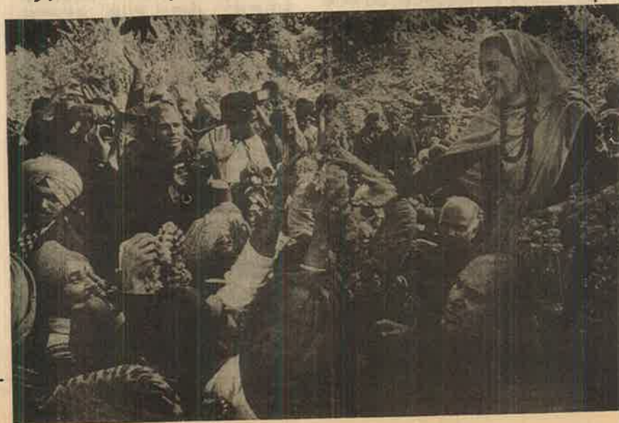
எதிர்ணியை வீழ்த்த கவர்ச்சிவாதத்தில் தஞ்சம் புகுந்தார் பாசிச திந்திரா

அவசரநிலை ஆட்சிக்குப்பிறகு பிரச்சாரங்கள், விளம்பரங்கள்- கூட்ட ஏற்பாடுகள் உட்பட எல்லாத் தேர்தல் வேலைகளும் தொழில் ரீதியில் நடத்துபவர்களுக்கே ஒப்படைத்து காங்கிரசு. மற்ற தேர்தல் அரசியல் கட்சிகளும் அதைப் பின்பற்றத் தொடங்கின. டெல்லி, பம்பாய் போன்ற பெரும் நகரங்களில் தேர்தல் கூட்டங்களுக்கு (ஆள் சப்ளை) மக்களைத் திரட்டத் தருவதையே தொழிலாகக் கொண்டே கும்பல்கள் உள்