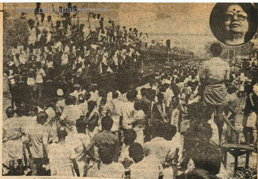
பொறுக்கி அரசியல் வேர்விட்டுப் பறக்கும்படி. தூண்கள் கட்டிக் கட்டித் தூண்கள் ரயில் கிணர் மீதேறி தொண்டர்கள் யாத்திரை.

தரகு அதிகார முதலாளிகள்மற்றும் நிலப்பிரபுத்துவத்தின் நலன்களைத் தொடர்ந்து கட்டிக் காத்து வளர்ப்பது. அதே சமயம் சோசலிசம், கம்யூனிசம் பற்றிய பாமர மக்களின் மிக மிக மோசமானகருத்துக்கேற்ப கவர்ச்சிவாதம்(பாபுலிசம்) நடவடிக்கைகளை மேற்கொள்வது. இதுதான் எம்ஜிஆர் கடைப்பிடித்த அண்ணாயிசம். தேசியமர், திராவிடமர் என்றுஎம்ஜிஆரின் அரசியல் நிலைப்பாடுகளைக்கூட பாருபடுத்திப் பார்க்க முடியாமல் கவர்ச்சிவாதத்தால் மக்களை அடித்து வீழ்த்துவது; மொழி, இன ஒடுக்கு முறை பாசிச, குரூர், கோமாளித் தனமான ஆட்சி இருந்தாலும் சத்துணவு, பற்பொடி, சேருப்பு, வேட்டி, சேலை, தண்ணீர் குடம், வறட்சி, வெள்ளம், தீ நிவாரண அன்பளிப்புகள் ஆகிய இலவசத்திட்டங்களால்நல்லாட்சிநடப்பதாக ஒரு பிரமையை உருவாக்குவது; தொழிலாளர்கள், விவசாயிகள், மாணவர்கள், ஆசிரியர்கள்—அரசு ஊழியர்கள் ஆகிய எந்தச் சமூகப் பிரிவினர்கள் தமது உரிமைகளுக்காகப் போராடும்போதும் ஈவிரக்கமின்றி நசுக்கும்போதே ஆட்சியாளர்களின் வள்ளல் தன்மையை பறைசாற்றும் "அன்பளிப்பு"களால்