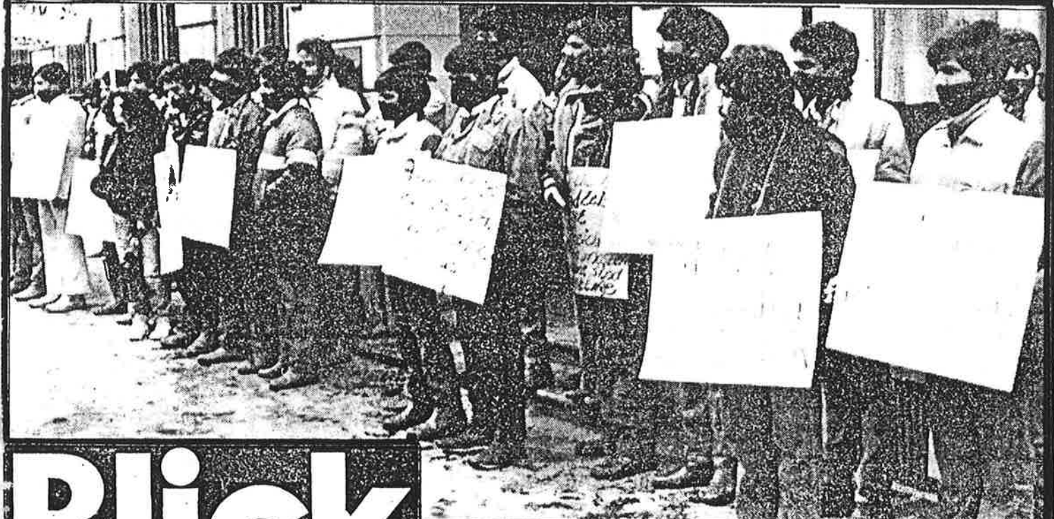
● Mit Protestplakaten demonstrieren die Tamilen in der Nähe des Bundeshauses.

தஞ்சை பங்குன் மாதம் 1986 ஆண்டு பத்திரிகைத் தொழிலாளர்.