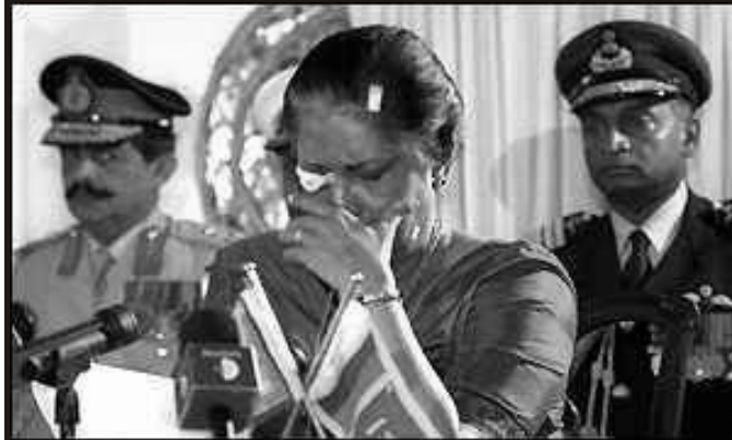
இதனை அவதானித்த புலிகள் இயக்கம் தமது பலாலித் தளத் தாக்குதலைக் கைவிட்டனர். அத்துடன் பேச்சுவார்த்தைக்கு நோர்வேயின் மீதான நம்பிக்கையுடன் சென்றனர்.

ரணில் தலைமையிலான அரசாங்கத்தின் கீழும் பேச்சுவார்த்தை இருதரப்பிலும் இடம்பெற்றது. ஆனால், குறைந்தபட்ச இடைக்காலத் தீர்வுக்கான ஒரு நிர்வாக சிமைப்பை உருவாக்கும் நோக்கில் தத்தம் நிலைப்பாட்டில் இருந்து கீழிறங்க இரு தரப்பினரும் மறுத்து வந்தனர். அதேவேளை பாரதாளுமன்ற அதிகாரத்தை பெருநீருந்து ரணிலுக்கும் நிறைவேற்று அதிகாரத்தைப் பெருநீருந்து சந்திரிகாவுக்கும் இடைக்காலம் வழியிற் செல்ல முடியவில்லை. ரணில் செய்து கொண்டிருந்த பரிந்துரை அடிப்படையில் தீவிர பேரினவாதிகளும் எதிர்த்து வந்தனர். அதேவேளை புலிகள் இயக்கம் இச்சமாதான காலத்தைப் பயன்படுத்தி தமக்குரியவந்திரச் செய்தும் பெருநீரும் கொண்டது.