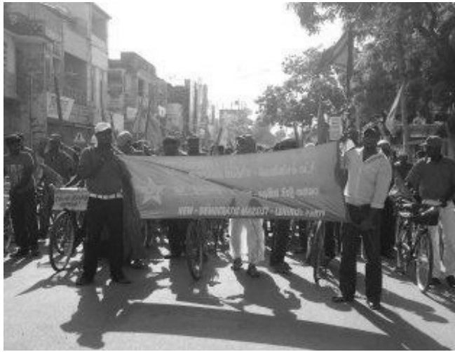
இவ்வாறான நிலப்பறிப்பு வடக்கு கிழக்கில் மட்டுமன்றி மலையகத்திலும் காலாதிகாலமாக நடைபெற்று வரும் ஒன்றாகும். மலையகத் தோட்டங்களில் இன்றும் கூட ஒரு துண்டு நிலம் மலையக மக்களுக்கு வழங்கப்படவில்லை.

பும் நில ஆக்கிரமிப்பும் நடைபெறுகிறது. எனவே முற்றிலும் பேரினவாத நோக்கிலும் போக்கிலும் தான் இவை நடைபெறுகின்றன. கிழக்கில் தொடங்கப்பட்டு வடக்கின் எல்லையோரங்களை அண்டிய நிலங்களில் திட்டமிட்ட குடியேற்றங்களைக் கொண்டு வந்து இன்று அவற்றை விஸ்தரிக்கும் போக்கு அதிகரிக்கப்பட்டு வருகிறது. இதற்கு ஏதுவாகவே பல்வேறு அபிவிருத்தி திட்டங்கள் முன் கொடுக்கப்படுகின்றன. வடக்கில் தாங்கள் தீர்மானிக்கும் இடங்களில் எல்லாம் பௌத்த விகாரைகளும் புத்தர் சிலைகளும் உருவாக்கப்படுகின்றன. இவை மத நல்லெண்ணத்தோடு செய்யப்படுவன அல்ல. முழுக்க முழுக்க இனமோதலைத் தூண்டக்கூடிய வகையில் செய்யப்படுவதாகும். இது பற்றி அண்மையில் தேசிய பிக்குகள் முன்னணி சார்பில் ஒரு அறிக்கை வெளியிடப்பட்டதைக் காண முடிந்தது. அதில் பௌத்தர்கள் வாழும் பிரதேசங்களில் பௌத்த விகாரைகளையும் புத்தர் சிலைகளையும் பாதுகாத்துக் கொள்ளாத அரசு ஏன் பௌத்தர்கள் இல்லாத வடக்கில் வலிந்து விகாரைகளையும் புத்தர் சிலைகளையும் வைக்க வேண்டும் எனக் கேட்டிருந்தது.