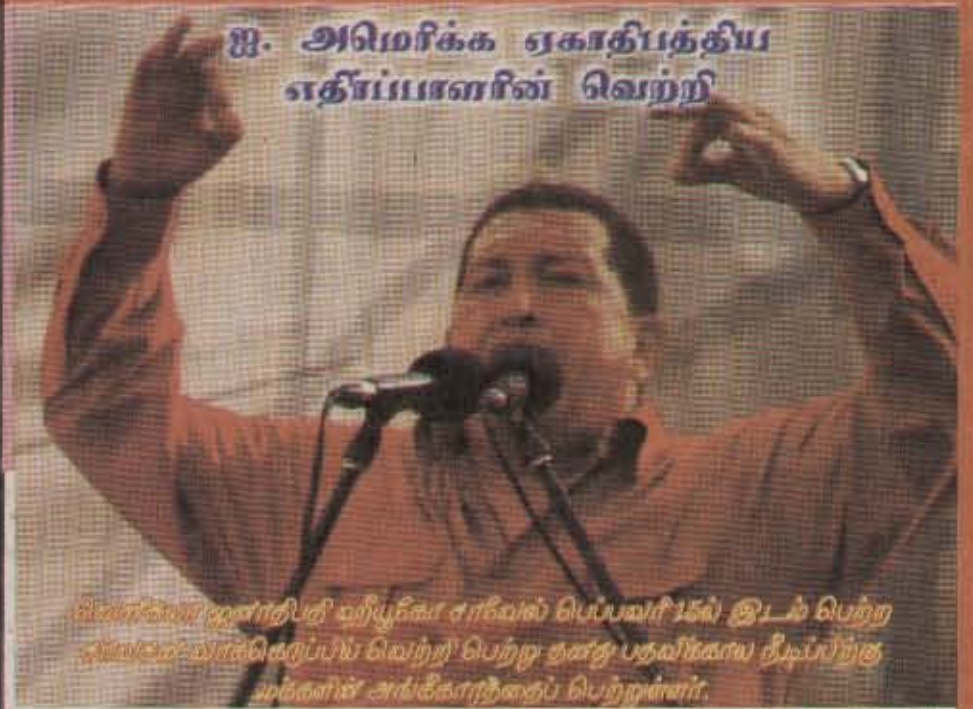
ஐ. அமெரிக்க ஏகாதிபத்திய எதிர்ப்பாளரின் வெற்றி

வெள்ளிக்கிழமை காலை சரீவால் பெப்பவரிடம் இடம் பெற்ற சமீபகால வாக்கொர்ப்பிஸ் வெற்றி பெற்ற தனது பதவிகளைய நீடிப்பிற்கு மக்களின் அங்கீகாரத்தைப் பெற்றுள்ளார்.