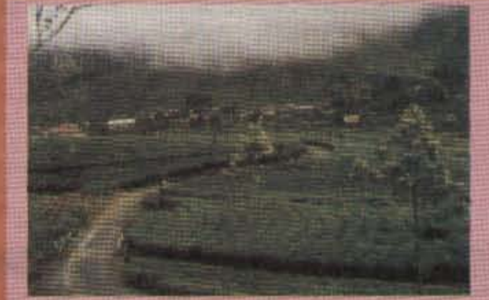
இலங்கையின் ஏற்றுமதிப் பொருளாதாரத்தின் முக்கிய பங்கு வகிப்பது பெருந்தோட்டத்துறையாகும். முன்பு பிரித்தானிய வெள்ளையரிடமும் பின் அரசாங்கத்திடமும் அதன் பின்