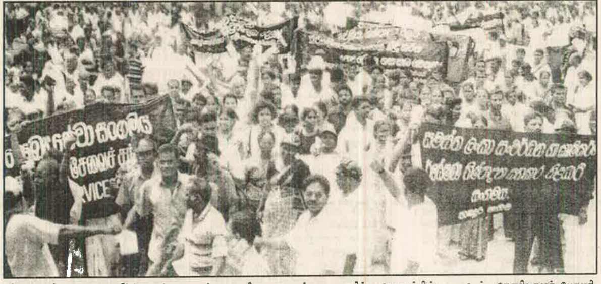
விடுவாசி உயர்வை எதிர்த்து சம்பள உயர்வு கோரி சமாதானத்தை ஆதரித்து கோழும்பில் நடைபெற்ற தோழிவாள் பேரணி

வாழ்க்கைச் செலவு அதிகரிப்பை எதிர்த்தும் தனியார் மயத்தை எதிர்த்தும் சம்பள உயர்வைக் கோரியும் தொழிற்சங்கங்கள் நடத்தியும் போராட்டங்களில் வடக்கு-கிழக்கு தொழிலாளர்களும் இணைந்துள்ளனர். அத்துடன் வடக்கு-கிழக்குப் பிரச்சினைக்கு அரசியல் தீர்வு காணப்பட வேண்டும் என்பதும் தொழிற்சங்கப் போராட்டக் கோரிக்கைகளில் முக்கியமானதாக இருக்கிறது. இடதுசாரி தொழிற்சங்கங்கள் எவ்வித நியந்தனையுமின்றி யுத்தத்தை எதிர்த்து சமாதானத்தை ஆதரிக்கின்றன. அதேபோன்று எவ்வித விட்டுக் கொடுப்பமின்றி தொழிலாளர்களின் உரிமைக்காக போராடும் கடப்பாடுடையன என்பதை