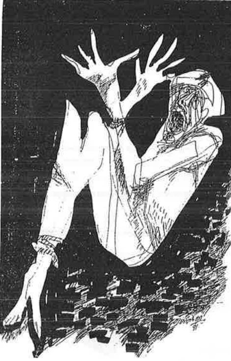
(சென்ற இதழில் இக் கட்டுரைத் தொடரின் கடைசிப் பந்தி)

1918 ஜேர்மன் புரட்சிக்கு முந்திய காலத்திலேயே நடுத்தர வர்க்கத்தின் கீழ்மட்டத்தின் சரிவு நிகழத் தொடங்கிவிட்டது. ஆயினும் இந்தச் சரிவு பெரிய பாதிப்பை ஏற்படுத்தாதற்குப் பல காரணங்கள் உள்ளன. ஏனெனில் இவ் வர்க்கத்தினை நிலைநிறுத்தும், முட்டுக் கொடுக்கும், காரணிகளும் இங்கே காணப்பட்டன. முடியாட்சியின் அதிகாரம் யாராலுமே எதிர்க்கமுடியாததொன்றாக இருந்தது. இதனுடன் தங்களை இனம் கண்டு கொண்டும் இதனுடன் சார்ந்துமிருந்த நடுத்தர கீழ்த்தட்டு வர்க்கம் தங்களைப் பாதுகாப்பானவர்களாகவே கண்டு கொண்டது.