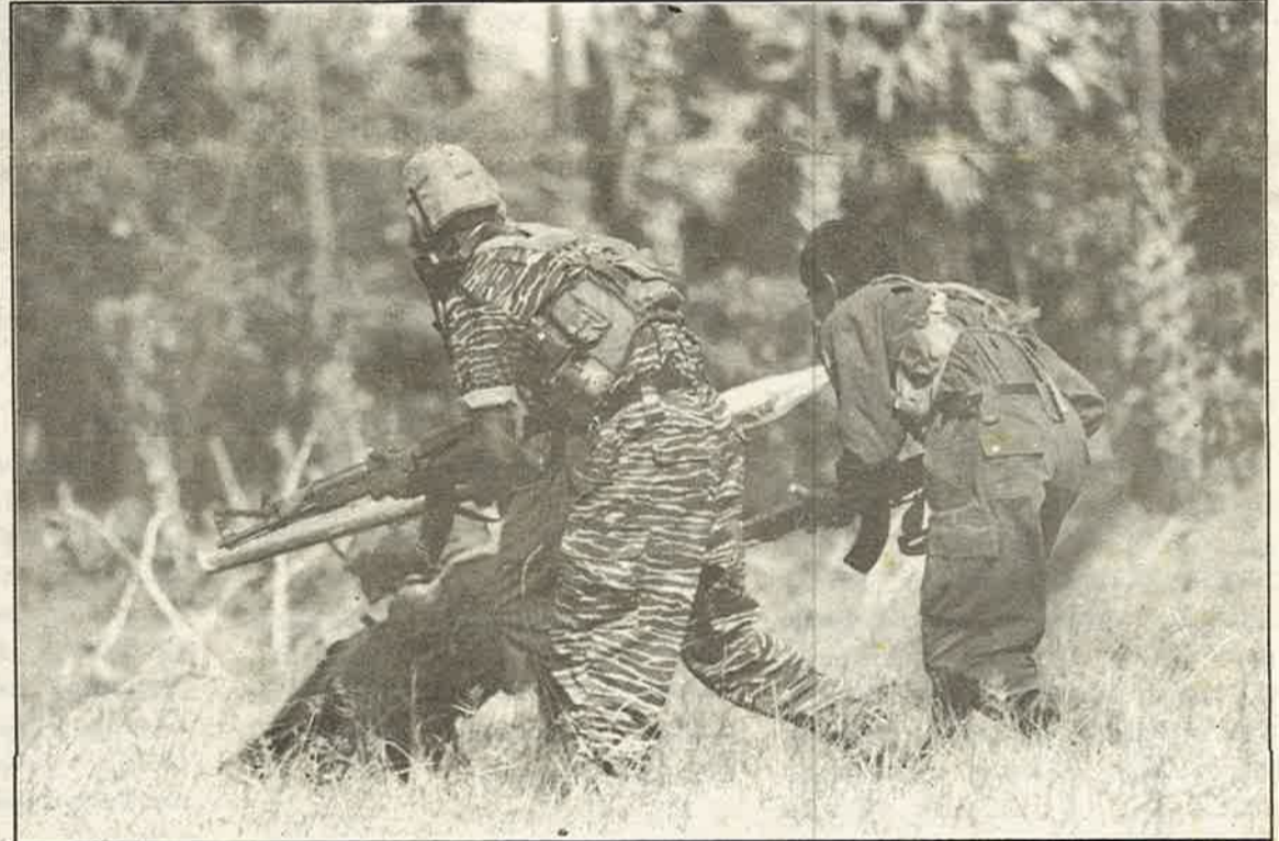
மண்ணிலொரு பிடிவெனினும் அள்ளவரும் கைதறிக்கக் காத்திருக்கும் தமிழர் சேனை