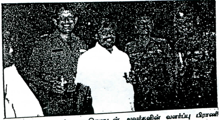
ஆக்கிரமிப்பு ராணுவத் தளபதிகளுடன் அவர்களின் வளர்ப்பு பிராணி வரதாச பெருமான் மது அருந்தி மகிழ்ச்சி

விடுதலைப் புலிகள் எப்போதுமே தங்களது ஆதிக்கத்திற்கு தடையாக இருக்- கும் யாரையும் அனுமதிப்பதில்லை. அதே வேளையில் தங்களின் ஆதிக்கத்திற்கு பயன்படும் பட்சத்தில் அவர்கள் யாருட- னும் சமரசம் செய்து கொள்ளத் தயங்கிய- தும் கிடையாது. இதுதான் அவர்களின் இயக்கம் தோன்றியதிலிருந்தே கடைபிடிக்க- கும் கொள்கை. மற்றபடி அவர்களின் 'சோசலிச தமிழ் ஈழம்' போன்ற கொள்கை- யெல்லாம் அதிகாரத்தை கைப்பற்ற அவர்- கள் பயன்படுத்தும் படிக்கட்டுகளே.