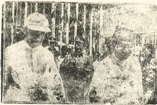
ஜே ஆர். - தெரிண்டமான்

தின் பெரும் தொழிற்சங்கமான தோட்டத் தொழிலாளர்களைக் கொண்ட இலங்கைத் தொழிலாளர் காங்கிரசின் தலைவர் எஸ். தொண்டமான் எதிர்ப்புரட்சி திட்டங்களை தயார் செய்யும் யூ.என்.பி. அரசாங்கத்தின் அமைச்சர் அவையின் உறுப்பினர் ஆவார். தோட்டத் தொழிலாளர்களுக்கு எதிரான தாக்குதல்களின் முக்கிய ஏஜன்டாக தொழிற்படுவரும் அவரே.