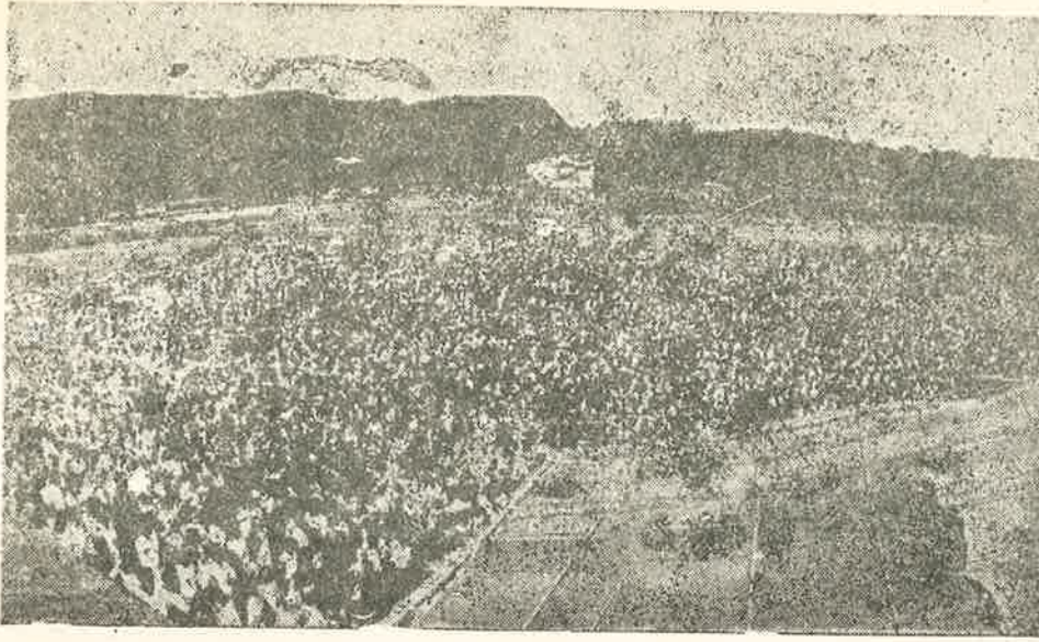
தோட்டத் தொழிலாளர்களின் மாபெரும் கூட்டம்

அவர்கள் வாழும் நிலப்பகுதிகளும் அடங்கியதே ஈழம் ஆகும். இதற்காகப் புலியியல், அரசியல் வரலாறு ஆராயப்பட்டு வடக்கும் கிழக்கும், மலையகப் பகுதியும் உள்ளடக்கிய ஈழம் என்ற அரசியல் வரையறையை முன் வைத்துள்ளோம். இம்மசுகள் ஈரோசுடன் இணைந்து அரசியல் விழிப்படைந்து, ஈழம் போராட்டம் தமது விடுதலையை உள்ளடக்கியதொன்றை புரிந்து கொண்டு செயற்படுகின்றார்கள்'' (மீட்போலை சஞ்சிகை - பாலகுமார்)