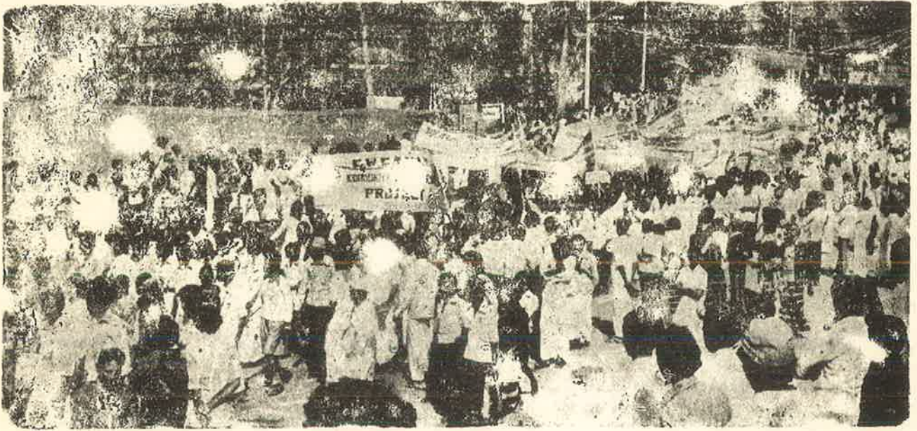
இ. தெர். க: ஊர்வலம்

இரண்டாவது உலக யுத்தத்தின் பின் அமெரிக்க ஏகாதி