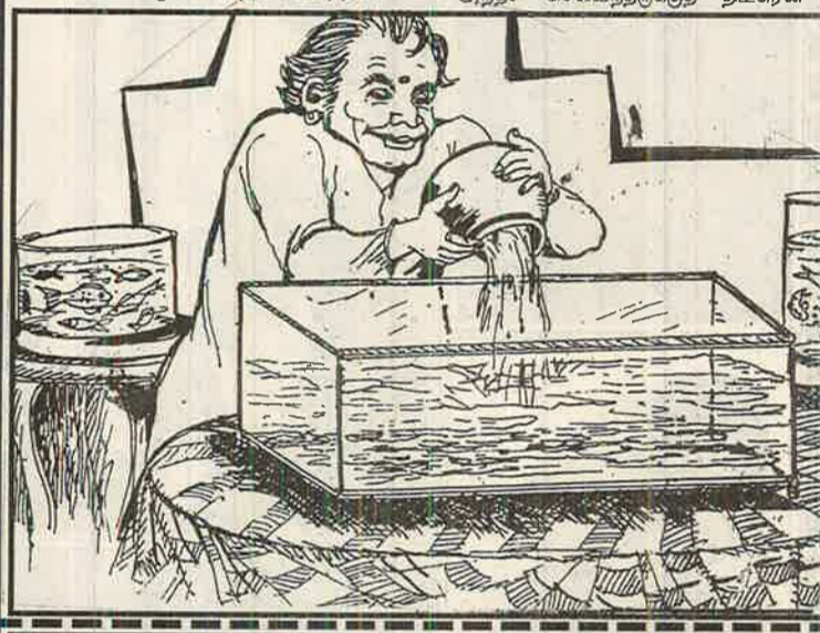
சீறந்த வர்ணத்திற்கு பரிசு தரும் எண்ணம்!

இரும்புப் பெட்டியில் கட்டுக்கட்டாகப் பணம், தங்க, வைர நகைகள் என எல்லாம் தேவைக்கு மேலாக இருந்தன. அந்தச் செல்வந்தருக்குத் திடீரென