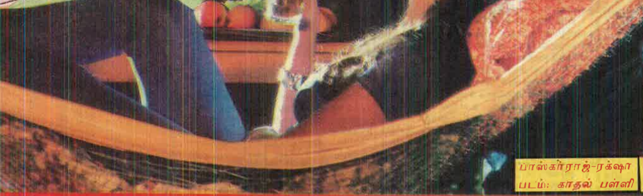
பாஸ்கர் ராஜ்-ரக்ஷா படம்: காதல் பள்ளி

அடித்தடி மோதலாகிவிட்டது. முடிவில் இருவரும் பிரிந்தனர். பின்னர் மு.க. நடிகர் படங்களை இயக்கத் தொடங்கினார். சினிமா சாராத ஒரு பெண்ணை மணந்துகொண்டார் பின்னர் ரயில் நடிகைக்கும் 'விஜயமாவ நடிகருக்கும் இடையே நெருக்கம் முற்றியது. நடிகையின் வீட்டு கதியென்று கிடந்தார். ஒருநாள் மது மாது மயக்கத்தில் ரயில் நடிகைமீடும் 'உன்னை மணந்து கொள்கிறேன்' என்று தேதிகூட குறிப்பிட்டுச் சொன்னார் நடிகர். மயக்கம் தெளிந்த பின்னர் நடிகைமீடும் சொன்னதை மறந்துபோனார். நடிகையோ அந்தத் தேதியில் எல்லாம் தயார் செய்துவிட்டு அழைக்க 'தனக்கு எதுவும் தெரியாது' என்று விட்டார் நடிகர். அதன்பின்னர் அவரகனது மோதல் திரைப்பட விழாக்களிலும் எதிரொலித்தது. இந்த விஷயம் ஆறுவதற்குள் நடிகர் வெறொரு பெண்ணை மணந்துகொண்டார். நடிகையும் வெளிநாட்டு மணமகனை மணந்து கொண்டு திரும்பப் புறப்படுகின்றார். இப்போதும் நடிகிறார்.