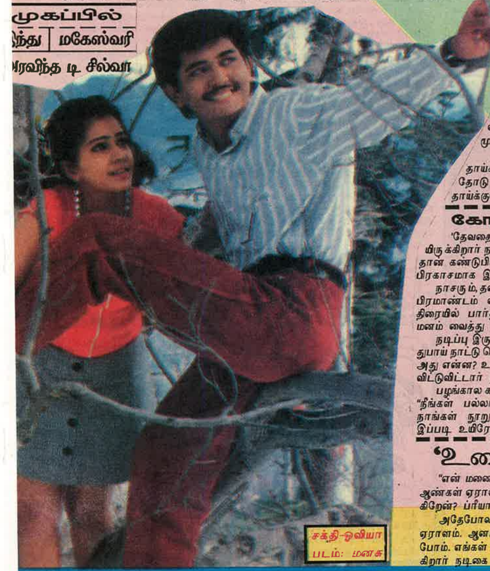
சக்தி-ஓவியா படம்: மனசு