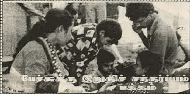
பேர்க்கு இறுதிச் சந்தர்ப்பம் பக்கம் - 08