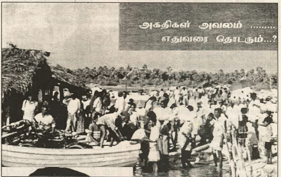
அகதிகள் அவலம் ..... எதுவரை தொடரும்...?

இப்படி அகதிகளாகவே மக்களை பாராமரிப்பதில் ஈடுபடப்போகிறோமா அல்லது யுத்தத்தை முடிவுக்கு கொண்டுவரவும், தமிழ் மக்கள் சுயமரியாதையுடனும், கௌரவத்துடனும் நிம்மதியாக வாழக்கூடிய ஒரு சூழ்நிலையை உருவாக்க அனைத்துக்கட்சிகள் இயக்கங்கள், தமிழ் மக்களின் நலன்விரும்பிகள் இணைந்து செயற்படப்போகின்றோமா? என்பதே இன்று எம்முன் உள்ள முக்கிய கேள்