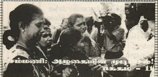
சம்மணி: அழகையின் முடி... பக்கம் - 11