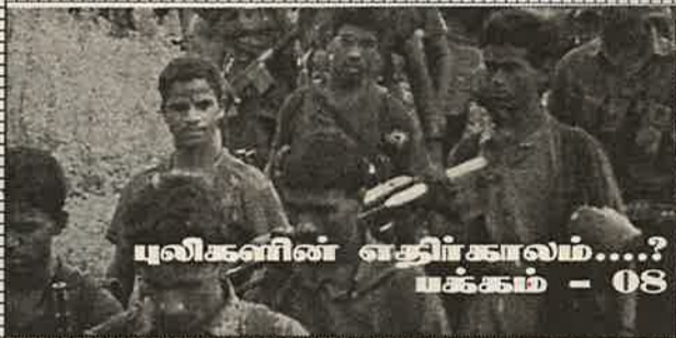
புலிகளின் எதிர்காலம்...? பக்கம் - 08