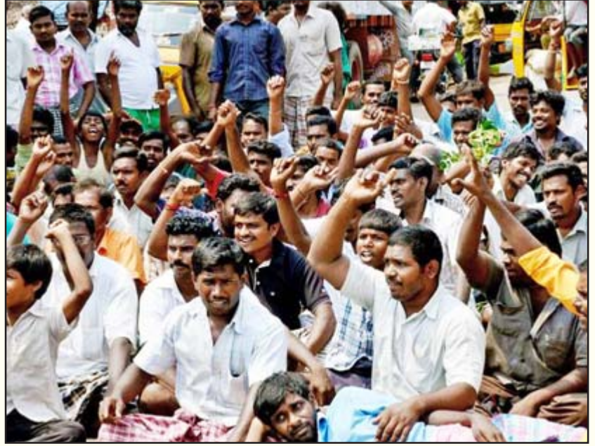
ஒருபுறம் மின்வெட்டு; மறுபுறம் மின் கட்டண உயர்வு என்ற இரட்டைச் சமையைக் கண்டித்து சேலம் மாவட்டத்திலுள்ள வீரமனார் பகுதி விசைத்தறி உற்பத்தியாளர்கள் நடத்திய சாலைமறியல். (கோப்பு படம்)