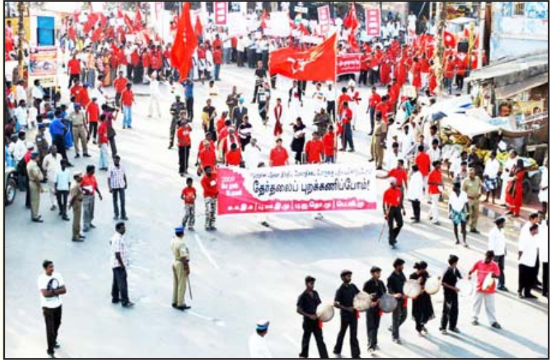
ம.க.இ.க. உள்ளிட்ட புரட்சிகர அமைப்புகள் இணைந்து, 2009-ஆம் ஆண்டு மே தினத்தன்று, “ஈழத்தின் மீதான இந்திய மேலாதிக்கப் போருக்குப் பதிலடி கொடுப்போம்!” என்ற அரசியல் முழக்கத்தை முன்வைத்து தஞ்சையில் நடத்திய ஆர்ப்பாட்டப் பேரணி. (கோப்புப் படம்)