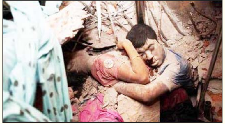
ஏழை நாட்டுத் தொழிலாளர்களைப் பலிகொள்ளும் அமெரிக்க டாலரின் கொடூரம்: கட்டிட இடிபாடுகளில் சிக்கி மாண்டு போன இளம் தொழிலாளர்கள்.

ஏப்ரல் 23-ஆம் தேதியன்று அந்தக் கட்டிடத்தின் மூன்றாவது தளம் பிளந்து தொங்கிவிட, போலீசார்கட்டிடத்திற்கு சீல் வைத்தனர். ஆனால், மறுநாளே அதே கட்டிடத்தில் வேலை செய்யும்படி தொழிலாளர்கள் நிர்பந்திக்கப்பட்டனர். மறுத்தால், அந்த மாதம் முழுவதும் வேலை செய்ததற்கான சம்பளம் கிடைக்காது என நிர்வாகம் மிரட்டியதால், வேறு வழியின்றித் தொழிலாளர்கள் வேலைக்கு வந்தனர். காலை நேரத்தில் மின் தடை ஏற்பட, ஜெனரேட்டரை பயன்படுத்தியுள்ளனர். அதன் அதிர்ச்சியைத் தொடர்ந்து ஒரு சில நிமிடங்களில் மொத்தக் கட்டிட முழுமே இடிந்து விழுந்துள்ளது.