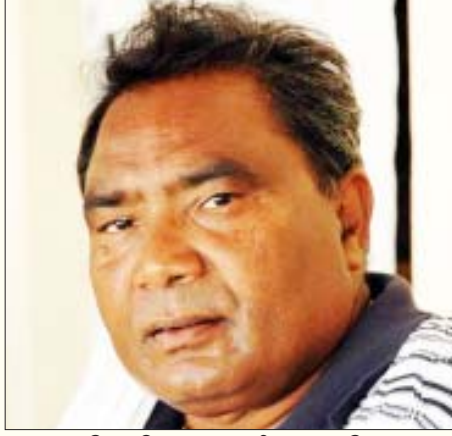
கார்ப்பரேட் நிறுவனங்களின் ஆதரவோடும், காங்கிரசு மற்றும் பா.ஜ.க.வின் ஆசியோடும் கட்டியமைக்கப்பட்ட பாசிச பயங்கரவாத சல்வாஜூடும் குண்டர் படையலைவன் மகேந்திர கர்மா.

பட்டுச்சாம்பலாக்கப்பட்டுள்ளன. ஏறத்தாழ 20 லட்சம் மக்கள் கட்டாயமாக வெளியேற்றப்பட்டு நாடோடிகளாக்கப்பட்டுள்ளனர். 50,000-க்கும் மேலான மக்கள் அவர்களது வாழ்விடங்களிலிருந்து இழுத்துச் செல்லப்பட்டு கட்டாய நிவாரண முகாம்களில் அடைத்து வைக்கப்பட்டுள்ளனர். பல நூற்றுக்கணக்கான பெண்கள் பாலியல் வன்முறைக்கு ஆளாக்கப்பட்டுள்ளனர். இவற்றில், மகேந்திர கர்மாதானே தலைமையேற்று வழிநடத்திய சூறையாடல்களும் அட்டுழியங்களும் ஏராளம். இதனாலேயே இவன் ‘பஸ்தார் புலி’ என்று ஆளும் கும்பலால் அழைக்கப்பட்டான்.