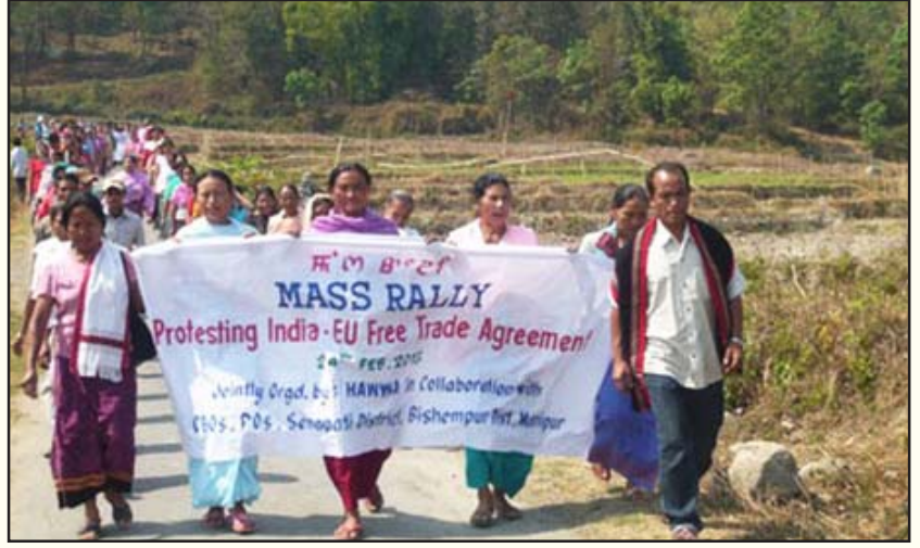
இந்திய - ஐரோப்பிய ஒன்றிய சுதந்திர வர்த்தக ஒப்பந்தத்தை ரத்து செய்யக் கோரி மணிப்பூர் மாநில வர்த்தகர்களும் உழைக்கும் மக்களும் இணைந்து கடந்த பிப்ரவரியில் நடத்திய ஆர்ப்பாட்டப் பேரணி.

ஒரு ஐரோப்பிய கார்ப்பரேட் நிறுவனம் ஒரு ஊரில் விவசாய நிலங்களை கணிசமான அளவுக்கு வாங்கி, அதில் மிகப் பெரிய பண்ணையை நிறுவி அதற்காக ஆழ் குழாய் கிணறுகளை அமைத்து வரைமுறையின்றி நீரை உறிஞ்சி விவசாயம் செய்யலாம். இதனால், அருகிலுள்ள சிறு விவசாயிகளின் பாரம்பரியமான கிணறுகள் வற்றிப் போனால், அந்த விவசாயி அருகிலுள்ள ஐரோப்பிய