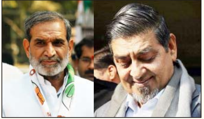
டெல்லி சீக்கியப் படுகொலையின் தளபதிகள்: சஜ்ஜன் குமார் (இடது) மற்றும் ஜகதீஷ் டைட்லர்.

டெல்லியில் சீக்கியர்களுக்கு எதிராக நடத்தப்பட்ட படுகொலை, பாலியல் வல்லுறவுகள், கலவரம், தீவைப்பு தொடர்பாக 740 வழக்குகள் தொடரப்பட்டதில், 324 வழக்குகள் விசாரணை எதுவுமின்றி ஊத்தி மூடப்பட்டுவிட்டன. நீதிமன்ற விசாரணை வரை சென்ற 403 வழக்குகளுள் 335 வழக்குகளில் குற்றவாளிகள் அனைவரும் விடுதலை செய்யப்பட்டுவிட்டனர். 13 வழக்குகள் என்ன நிலைமையில் உள்ளன என்ற விவரம் யாருக்குமே தெரியவில்லை. மீதி வழக்குகள் நீதிமன்றத்தில் நிலுவையில் உள்ளன.