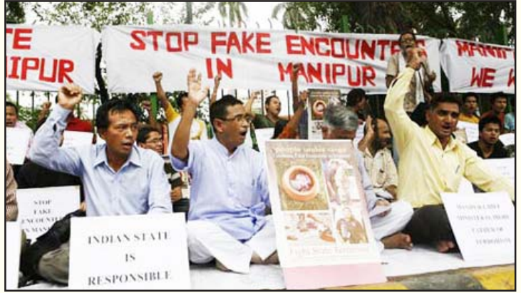
இராணுவமும் துணை இராணுவப் படைகளும் மணிப்பூரில் கண்மண் தெரியாமல் நடத்திவரும் போலி மோதல் கொலைகளைத் தடுத்து, விசாரணை நடத்தக் கோரி மணிப்பூரி மாணவர்களும், மக்களும் டெல்லி ஜந்தர் மந்தரில் நடத்திய முழுக்க ஆர்ப்பாட்டம் (கோப்புப் படம்)

ஆனால் 1949 அக்டோபரில், அந்நாட்டு மக்களின் கடும் எதிர்ப்புக்கு மத்தியில், மணிப்பூர் இந்தியாவுடன் பலவந்தமாக இணைக்கப்பட்டது. மணிப்பூரின் ராஜா புத்தசந்திராவை பேச்சுவார்த்தை என்று சொல்லி அழைத்து, ஷில்லாங்கில் வீட்டுக் காவலில் அடைத்த இந்திய அரசு, இராணுவத்தைக் குவித்து அவரை