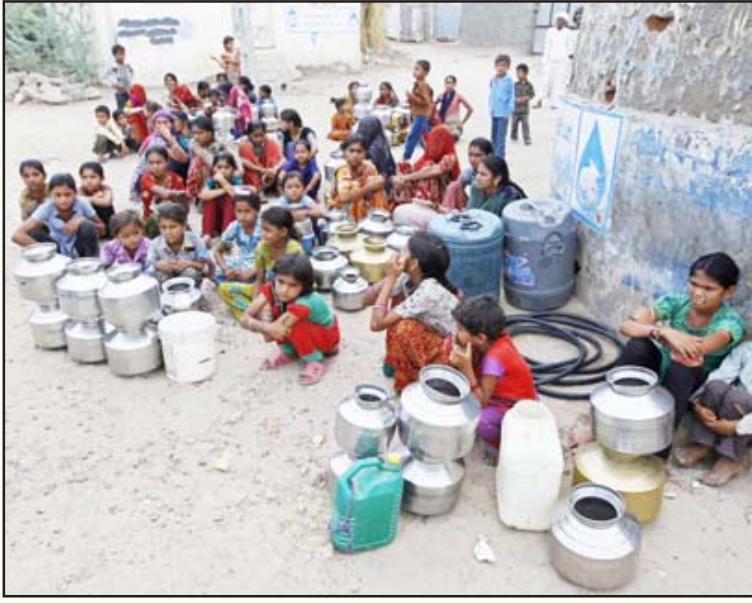
ஒரு குடும் தண்ணீருக்காகக் காத்திருக்கும் பாடன் கிராம மக்கள்.

டொரண்ட் பவர் ஜெனரேஷன் ஆகிய கார்ப்பரேட் நிறுவனங்களுக்கு வழங்கிய சட்டவிரோத சலுகைகளால் அரசிற்கு 580 கோடி ரூபாய் நட்டமேற்பட்டிருப்பதாகவும்; 2009-10 மற்றும் 2010-11 ஆகிய இரு நிதி ஆண்டுகளில் மட்டும் கார்ப்பரேட் நிறுவனங்களுக்கு காட்டப் பட்டுள்ள சட்டவிரோத சலுகைகளால் மாநில அரசிற்கு 17,000 கோடி ரூபாய் அளவிற்கு இழப்பு ஏற்பட்டிருப்பதாகவும் தணிக்கைத் துறை தனது அறிக்கையில் குறிப்பிட்டிருக்கிறது.