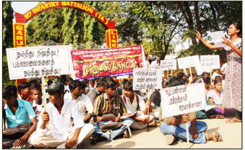
ராஜபக்சே கும்பலுடன் கைகோர்த்துக் கொண்டு ஈழத்தமிழின அழிப்புப் போரை நடத்திவரும் இந்திய அரசை அம்பலப்படுத்தி, 12.02.2009 அன்று திருச்சியில் அனைத்துப் பள்ளி - கல்லூரி மாணவர்களை அணிதிரட்டி, மத்தியப் பேருந்து நிலையம் அருகே உள்ள 117-ஆவது பிரதேச இராணுவப்படைத் தலைமை அலுவலகத்தை முற்றுகையிட்டு பு.மா.இ.மு. நடத்திய ஆர்ப்பாட்டம் (கோப்புப் படம்)

கசாப்புக்காரனிடமே காரணம் கோரும் கதையாக, கொலைகாரன் மன்மோகனிடமே, இங்குள்ள ஓட்டுக் கட்சிகள் ‘கோரிக்கை’ வைத்துக் கொண்டிருந்த சூழலில், தமிழக மக்கள் போராட்டங்கள் இந்திய அரசுக்கும் ஆளும் வர்க்கங்களுக்கும் எதிராக நடத்தப்பட வேண்டும் என்று ம.க.இ.க., பு.மா.இ.மு., பு.ஜ.தொ.மு., வி.வி.மு., பெ.வி.மு., ஆகிய அமைப்புகள் முன்வைத்தன. அந்த அடிப்படையில் அவ்வமைப்பினர், 2008 நவம்பரில் “ஈழத்தமிழர்படுகொலைக்குத் துணைநிற்கும் இந்திய அரசை முறியடிப்போம்”, “கொலைவெறி பிடித்த மன்மோகன் சிங்கே, உன் டாடாவும், அம்பானியும் கொள்ளையடிக்க எங்கள் ஈழத் தமிழர் சாக வேண்டுமா?” - என விண்ணதிரும் முழக்கங்களை எழுப்பி, சென்னை அண்ணாசாலையை மறித்து, நந்தனம் இராணுவ எஸ்டேட் அலுவலகத்தைத் திடீரென்று முற்றுகையிட்டுப் போராடினர். திருச்சி இராணுவ வளாகத்தை (கண்டோன்மெண்ட்)