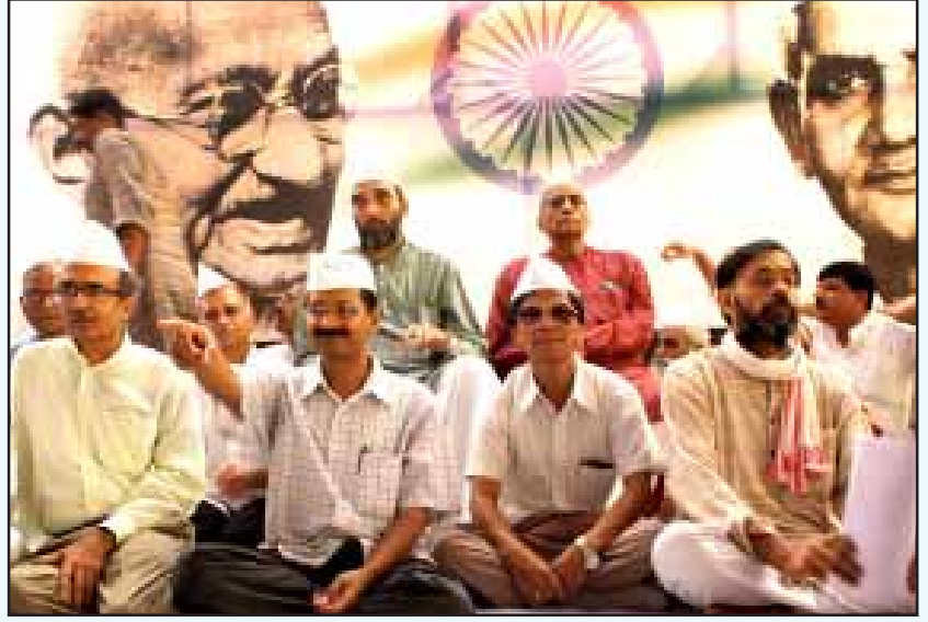
கேஜ்ரிவால் குழுவினர் போட்டுக்கொண்டுள்ளது காந்தி-நேரு குல்லாய் மட்டுமல்ல, கொள்கையுந்தான்!

இதற்கிடையே ஊழலுக்கு எதிராக மக்களிடம், குறிப்பாக நடுத்தர வர்க்கத்தினரிடையே நிலவிய பொதுக்கருத்தை - மனநிலையைப் பயன்படுத்திக் கொள்ள அன்னாஹுசாரே, கேஜ்ரிவால், கிரண்டேஷி, கார்ப்பரேட் சாமியார் ராம் தேவ் மூலமாக பா.ஜ.க. ஆகியோர் களத்தில் குதித்தனர். குறிப்பான ஊழல், அதிகார முறைகேடு விவகாரங்களை எல்லாம் புறங்கையால் ஒதுக்கித் தள்ளி விட்டு, பொத்தாம் பொதுவான ஊழல் எதிர்ப்பு மற்றும் “ஜன லோக்பால்” கோரிக்கையை முன்வைத்து, அறவழி அடையாளப் போராட்டங்களை நடத்தினர். அரசியல் சாணக்கியம் - சகுனித்தனத்தில் பழம் தின்று கொட்டை போட்ட காங்கிரசு கும்பல் இவர்களை எளிதில் முடக்கியது. பிறகு இலஞ்ச ஊழல், அதிகார முறைகேடுகளோடு பின்னிப் பிணைந்த தனியார்மயம் - தாராளமயம் - உலகமயமாக்கம் என்ற புதிய பொருளாதாரக் கொள்கையின் இரண்டாம் கட்ட சீர்திருத்தத்தை முன் தள்ளும் குறிக்கோளை எளிதில் சாதித்து விட்டது.