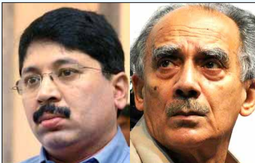
உச்ச நீதிமன்றத்தால் கண்டு கொள்ளப்படாத முன்னாள் தொலைத்தொடர்புத்துறை அமைச்சர்கள் தயாநிதி மாறன் (தி.மு.க.) மற்றும் அருண் ஷோரி (பா.ஜ.க.)

“இந்நீதிமன்றம் இயற்கை வளங்களை ஒதுக்கீடு செய்தவற்கு எந்தவொரு முறையையும் பரிந்துரைக்கவில்லை; எந்தவொரு முறையையும் தடை செய்யவில்லை. இயற்கை வளங்களைத் தனியாருக்கு ஒதுக்கீடு செய்ய எந்த முறையைப் பின்பற்றலாம் என முடிவெடுக்கும் அதிகாரம் நிர்வாகத்திற்கு மட்டுமே உண்டு. அம் முடிவு அரசியலமைப்பையும் பொதுநலனையும் மீறுவதாகக் கருதப்பட்டால், அதில் தலையிடும் அதிகாரம் உச்ச நீதிமன்றத்துக்கு உண்டு” என விளக்கமளித்திருக்கிறது.