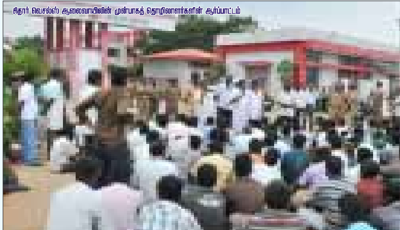
சிதார் வெசல்ஸ் ஆலைவாயிலின் முன்பாகத் தொழிலாளர்களின் ஆர்ப்பாட்டம்