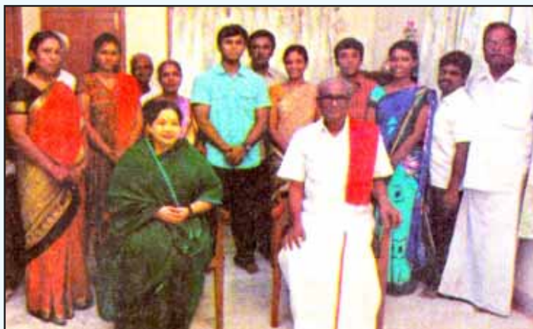
தா.பா.வின் 80-ஆவது பிறந்தநாளையொட்டி, வீட்டுக் 'கே' சென்று வாழ்த்து தெரிவிக்கும் ஜெயலலிதா!

“தா.பா.வின் கட்சியை கம்யூனிஸ்டு கட்சி என்று ஊர்ல இன்னமுமா நம்புறாய்ங்க?” என்று வாசகர்கள் கேட்கலாம். என்ன செய்வது, இருக்கிறார்கள்! அப்படி நம்பிக்கொண்டிருப்பவர்கள், தா.பா.வின் பேச்சுகளையும் நடவடிக்கைகளையும் பார்த்து அதிர்ச்சியடைகின்றனர். ஆனால் அக்கட்சியில் உள்ள ரொம்ப நல்லவர்கள் கூட, அதிர்ச்சியடையவில்லை. கொஞ்சம் சங்கடப்படுகிறார்கள்.