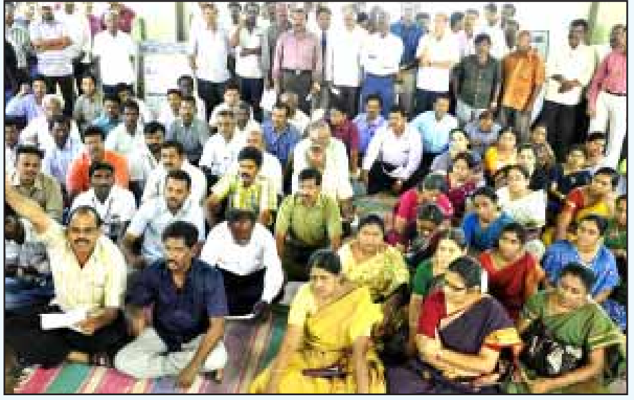
காப்பீடு துறையில் அந்நிய முதலீட்டை எதிர்த்து சென்னையில் எல்.ஐ.சி. ஊழியர்களின் போராட்டம்.