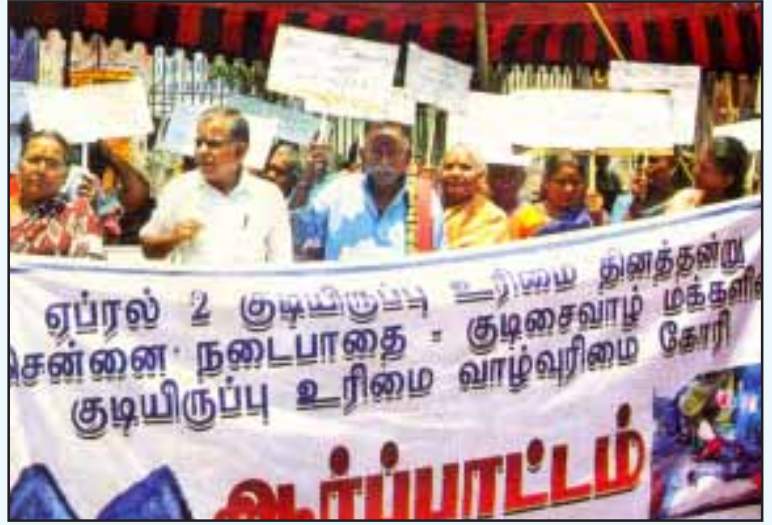
சென்னையில் குடிசைகளிலும் நடைபாதைகளிலும் வசித்துவரும் உழைக்கும் மக்களின் குடியிருப்பு உரிமையை வலியுறுத்தி, அமைப்புசாராத தொழிலாளர் கூட்டமைப்பின் தலைமையில் நடந்த ஆர்ப்பாட்டம்.

நகர்ப்புறக் குடிசைகளில் வாழ்ந்தபோது, வீட்டு வேலைகளுக்குச் சென்றுவந்த பெண்களுள் பலர், இடப்