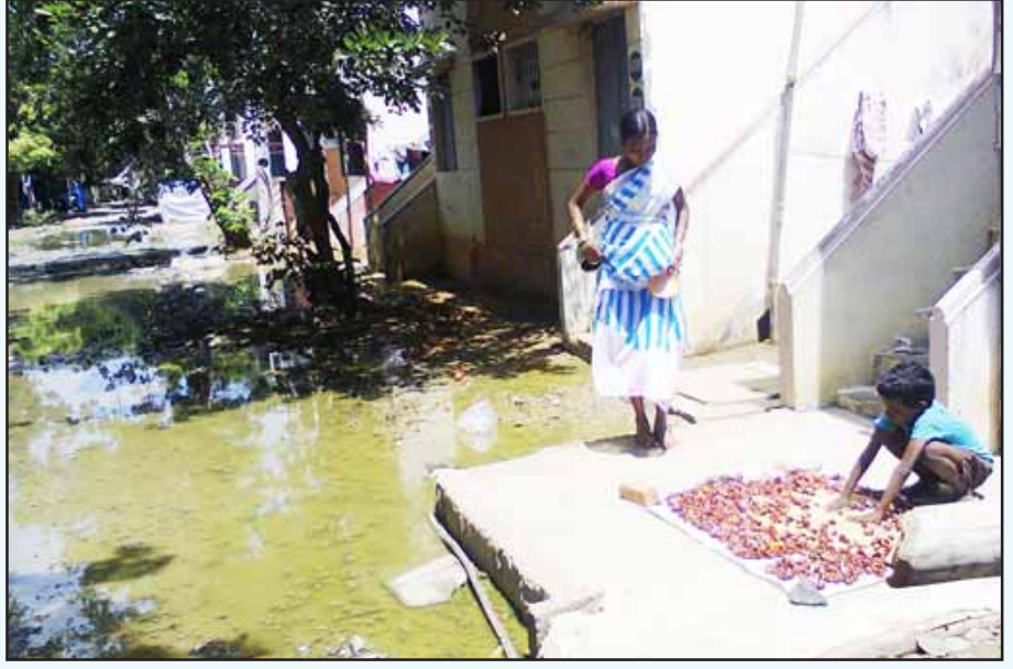
கழிவு நீரில் மிதக்கும் செம்மஞ்சேரி குடியிருப்புகள்: மறுகாலனியாக்கம் உருவாக்கிய நவீன சேரி.

குடிசைப்பகுதிகள் அப்புறப்படுத்தப்படுவதென்பது, 'சர்வதேசதரம் வாய்ந்த சிங்கார சென்னை' என்ற கனவுத் திட்டங்களை நிறைவேற்றுவதற்குரிய அவசியமான நடவடிக்கை என்பதாக ஆளும் வர்க்கம் சித்தரிக்கிறது. நடுத்தர வர்க்கமும் மகுடிக்குத் தலையாட்டும் பாம்பு போல இக்கருத்தை தீவிரமாக ஆதரிக்கிறது. ஒரு தெருவிலிருந்து மற்றோர் தெருவிற்கு வீட்டை மாற்றிக் கொள்வதைப் போன்றதல்ல இந்த இடப்பெயர்வு. நகர்ப்புற குடிசைப்பகுதிகளில் வாழ்ந்து வரும் உழைக்கும் மக்கள், சென்னை நகரத்திலிருந்து 30 - 40 கி.மீ. தொலைவுக்கு அப்பால் உள்ள செம்மஞ்சேரி, கண்ணகி நகர், ஒக்கியம், கார்பில் நகர், எர்ணாவூர், நல்லூர், கன்னடபாளையம் போன்ற இடங்களுக்கு விரட்டியடிக்கப்படுகின்றனர். இதனை அம்மக்களின் வாழ்வாதாரத்தைப் பறிக்கும் நடவடிக்கையாக இவர்கள் பார்ப்பதில்லை.