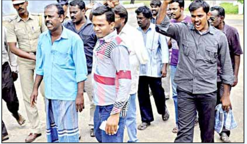
துடிப்பாகச் செயல்படுவதாகக் காட்டிக்கொள்ள போலீசு கிளப்பிய பயங்கரவாதப் பீதி: சென்னை-குன்றத்தூரில் மாவோயிஸ்டு தீவிரவாதிகளாகச் சித்தரித்துக் கைது செய்யப்பட்ட மக்கள் குடியரசுக் கட்சியினர்.

கடந்த அக்டோபர் மாதத்தில், வழக்குரைஞர்களும் கல்வியாளர்களும் மாணவர்களும் கொண்ட உண்மையறியும் குழுவினர் 11 பேர் கூடங்குளத்துக்குச் சென்ற போது, மாவோயிஸ்டு பயங்கரவாதிகள் என்று குற்றம் சாட்டி போலீசு கைது செய்ததோடு, அவர்களைத் தீவிரவாதிகளாகவும் சதிகாரர்களாகவும் அவதூறு செய்தது. இதேபோல, கடந்த மாதத்தில் சென்னை புறநகர்ப் பகுதியான குன்றத்தூரிலுள்ள ஒரு பள்ளியில் கூடி விவா