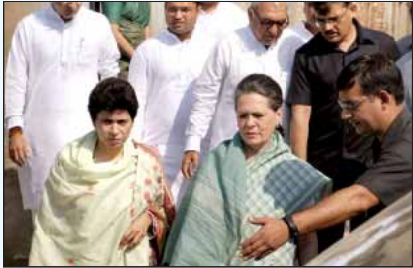
பாலியல் வல்லுறவுக்கு ஆளாகி, அவமானம் தாங்காமல் தற்கொலை செய்து கொண்ட தாழ்த்தப்பட்ட பெண்ணின் குடும்பத்தினரைச் சந்தித்த சோனியாவின் ஆறுதல் நாடகம்.

சோனியா அரியானாவிற்கு வந்து ஆறுதல் நாடகம் நடத்திச் சென்ற மறுநாளே, கைதால் என்ற கிராமத்தைச் சேர்ந்த திருமணமான தாழ்த்தப்பட்ட இளம் பெண் இரண்டு ஆதிக்க சாதி வெறியர்களால் பாலியல் பலாத்காரப்படுத்தப்பட்டார். குற்றவாளிகள் இருவரும் அப்பெண்ணிற்கு ஏற்கெனவே அறிமுகமானவர்கள் என்பதையும்; குற்றம் நடப்பதற்கு முன்பு அப்பெண் அவர்களோடு கைபேசியில் பேசியிருக்கிறார் என்பதையும் வைத்துக் கொண்டு, இவ்வழக்