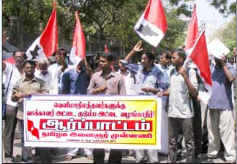
இடம் பெயர்ந்த பீகாரி கூலித் தொழிலாளியை சுற்றிவளைத்துத் தாக்கும் இனவெறி பாசிச ராஜ்தாக்கரே குண்டர்களின் அட்டூழியம் (மேல்படம்). வெளிமாநிலத்தவருக்குக் குடும்ப அட்டை தரக்கூடாது எனக் கோரி த.தே.பொ.கட்சியின் இளைஞர் அமைப்பினர் சென்னையில் நடத்திய ஆர்ப்பாட்டம்.

பத்திய உலகமயமாக்கலையும் அதன் கொடிய விளைவுகளையும் புரிந்து கொள்ள முடியாது. வட மாநிலத் தொழிலாளர்களுக்கு எதிராகத் தமிழ் மக்களின் பகையைத் தூண்டுவதென்பது, ஏகாதிபத்திய உலகமயமாக்கத்துக்குத் துணைபோவதுதானேயன்றி, அது தேசிய இனச் சிக்கலுக்கோ தீவிரமாகிவரும் பிரச்சினைகளுக்கோ ஒருக்காலும் தீர்வாக முடியாது. வட இந்தியத் தொழிலாளிகளால் தமிழனுக்குப் பாதிப்பு ஏதுமில்லை எனும்போது, இத்தகைய இனவெறியர்கள் தமிழனின் பெயரால், தமிழினத்தின் பெயரால் பேசுவதற்கு எந்த உரிமையும் கிடையாது. ஏகாதிபத்திய உலகமயமாக்கலுக்கு எதிரான பாட்டாளி வர்க்க உலகமயமாக்கம்தான் மாற்றுத் தீர்வாக முடியும். பாட்டாளி வர்க்க சர்வதேசியம்தான் பாட்டாளி வர்க்க உலகமயமாக்கத்துக்குப் பொருத்தமான அரசியல் அமைப்பாகவும் இருக்க முடியும். அத்தகைய நிசையில், இனவெறியர்களைத் தனிமைப்படுத்தி, ஏகாதிபத்திய உலகமயமாக்கலுக்கு எதிராகத் தேசிய எல்லைகளையும் தேசிய இன அடையாளங்களையும் கடந்த போராட்டங்களும் தொழிலாளர்களின் ஒற்றுமையுமே இன்றைய தேவையாக உள்ளது.